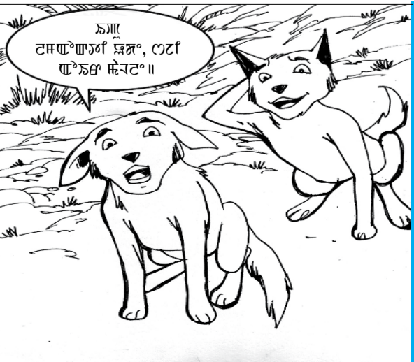
කෘතියේ නම සහ කලාකරුගේ නම පිළිබඳව විස්තරයක්.