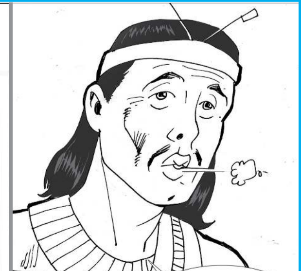
සමස්ත ජාතික චලනවල වැදගත්කම අධ්‍යයනය කිරීම මනිවිලි කිරීමක් වේ.