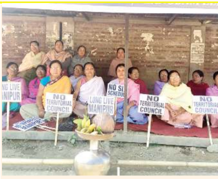
গাৰু জৰ্ণালাইট... (Caption describing the community meeting)