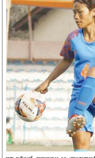
গাৰু জৰ্ণালাইট... (Caption for the sports image)

চমৎ, প্ৰথমৰ ১৭ (১৭) বছৰ... (Main text of the regional awareness article)