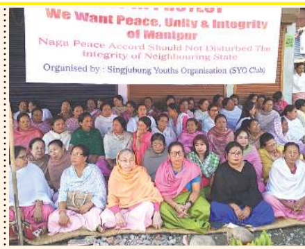
গাৰু জৰ্ণালাইট... (Caption describing the meeting)

ফেব্ৰুৱাৰী মাহৰ... (Introductory text for the February section)