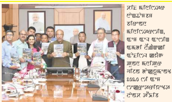
সৰ্বৈ ফিৰিওৱাৰ... (Caption describing the award ceremony)