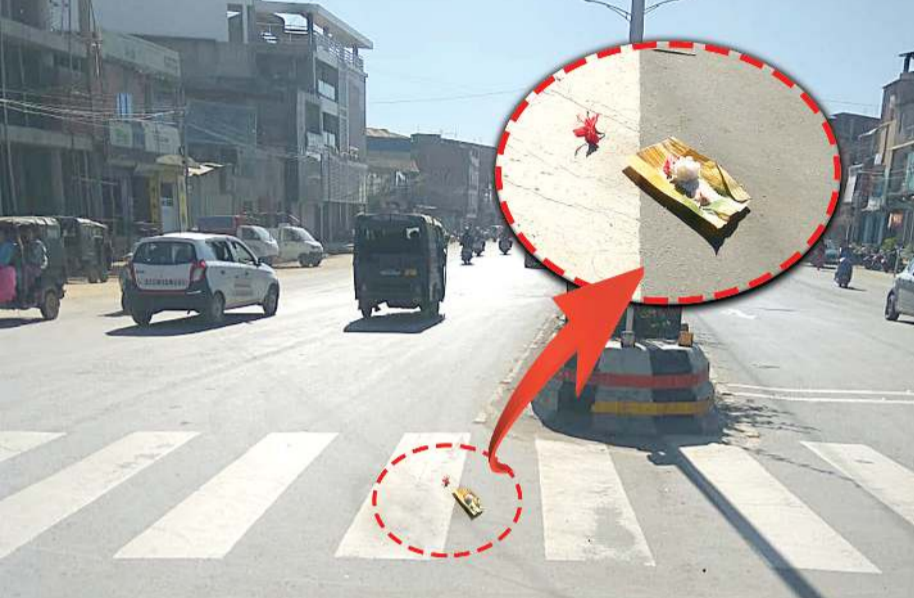
গাৰু জৰ্ণালাইট... (Caption for the street scene image)

চমৎ, প্ৰথমৰ ১৭ (১৭) বছৰ... (Main text of the regional awareness article)