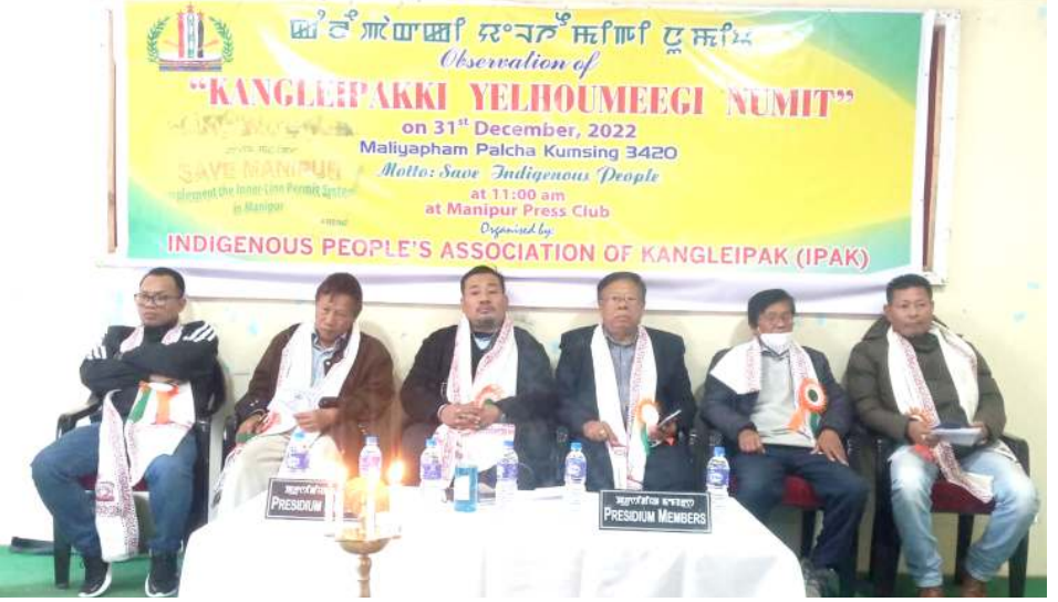
ইন্দিজিনস পিপলস এসোসিয়েশন গুফ কংলৈপাক (ইপাক) না শীন্দুনা পাঙথোকৰিবা কংলৈপাকী য়েলহৌমী নুমিং যৌৱমদা দাইস মেম্বৰ ওইখিৰিং

আই টি গুৱাহাটীৰিছ'স টিম অসিনা মথ তানা ফোণ্ডদোকৰিবা, হৌজিক অষ্টং অশাগী খলদা অওনবা কয়া লাক্লেবী অসিগী মতাংদা মালেমগী লৈবাকশিংনা মীংয়েং চঙদনা থবক পায়খংইহুইবদি চহী খৰগী মতুংদা মনা মশিং থাবা মফম কয়া শিজিৰা য়াৰক্তবগী ফিতমদা লাকপা য়াই হায়রি।