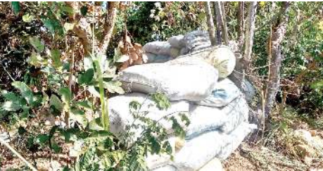
মীত খুলশিং তম্মা বোম অমসুং নোংম কাপথরকখিবা কাচুপ চিংখী বন্ধর য়োনা খুল ঙাকপশিংনা কুকি মিলিটেটশিং তকশিন্ত্রে, কুম্ভা ২০২৩ শেংন-খায়নবা 'বাই-বাই' গী থোরম মফম খরদা পাঙথোক্লবসু ফয়েং মমাঙ লোকায়গী নুপীশিংদি অহিং য়ারেজুনা খুল ঙাকখি

মোরোদা কম্মান্দোগী পোষ্টতা বোম কাপশিন্দুনা এটেক তৌরকপদগী কুকি মিলিটেটশিংগা অনীরক খুং থোক্রে, পর্সনেল ৪ শোকে, তুমখোংগী লানফমদনা খুল ঙাকপা ১ শোকে