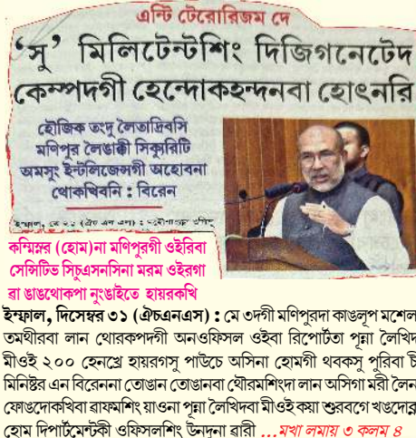
ইম্ফাল, দিসেম্বর ৩১ (এইচএনএস) : মে ওদগী মণিপুরদা কাঙলপ মশেলগী তমখিরাবা লান থোরকপদগী অনওফিসল ওইবা রিপোর্টতা পুন্না লৈখিদ্বে মীওই ২০০ হেন্ত্রে হায়রগসু পাউচে অসিদি হোমগী থবকসু পুরিবা চীফ মিনিষ্টর এন বিরেননা হোঙন তোঙনবা থোরমশিংদা লান অসিদি মরী লৈননা ফেড্ডোকখিবা রাফমশিং যাওনা পুন্না লৈখিদ্বে মীওই কয় শুরবগে খঙদেব্রো হোম দিপার্টমেন্টগী ওফিসলশিং অসিদি...মখা লমায় ও কলম ৪

ইম্ফাল, দিসেম্বর ৩১ (এইচএনএস) : মণিপুরদা চংলিবা চহী ২০২৩ অসিদি মনুংলা চিংমায়শিংদা পোপি পান্দী অমত্তা থাহল্লরোই অমসুং চিংমায়শিংদা দ্রোন শীজিমদুনা উ মরু থারগনি : বিরেন