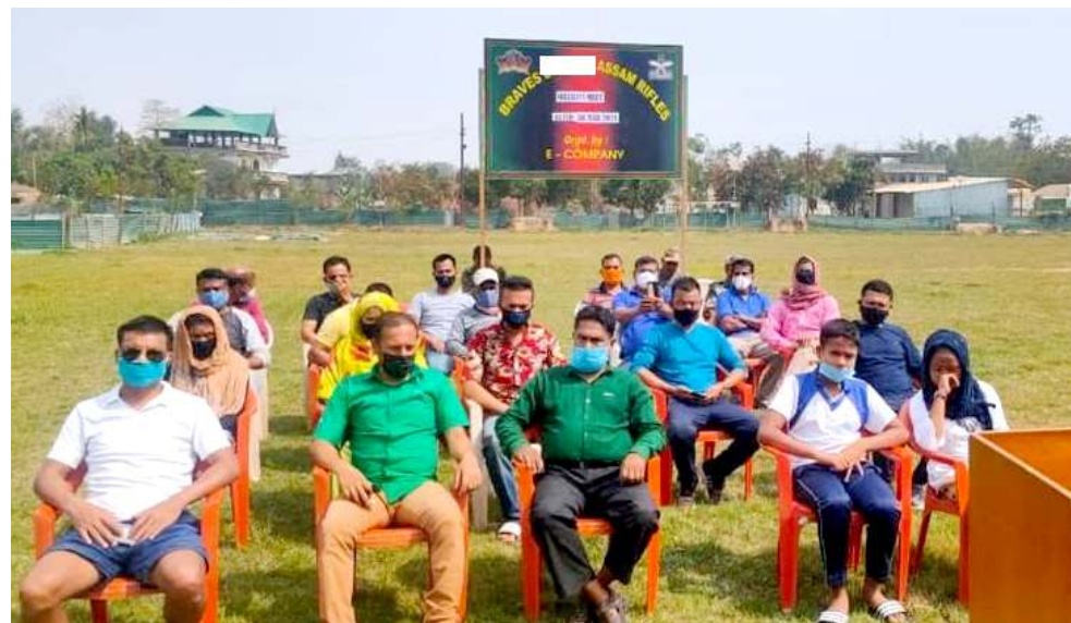
আই জি এ আৰ (সাতুখ) কী মীংয়েং মখালা কেথেলমানবি বটলিয়নগী ৯ সেক্টৰ অসাম ৰাইফলসনা যৌবাল দিষ্ট্ৰিক্টকী মনুং চো লৈবা লিগোং এ আৰ কাম্পনি ওপৰোই বেজতা পাঙথোকখিবা সেকুৱিটি কো ওৰ্দিনেসনগী যৌৱমদা শৰুক য়াখিৱশিং

অমৰোমদা নোংলৈ নুংশিং অদুনা মৰম ওইৱগা কমলপুৰ সব দিভিননী মফম খৰদি অতোপ্পা মফমশিংগা পাউ ফানবা গুমনা লৈৱি। লগীদা উপাধিংশিং কা হেন্না তেজুনা তামিনবিবা অমদি মোবাইল ট্ৰাৱাৰিং মথৌ ত্ৰেৱজবদনী পাউ ফাওনবা গুমখিৱবনি। হায়ৰিবা মফমশিং অসিদা ইলেক্ট্ৰিকী খুদোংচবা খুদী ওইনা লেখিৱেই।