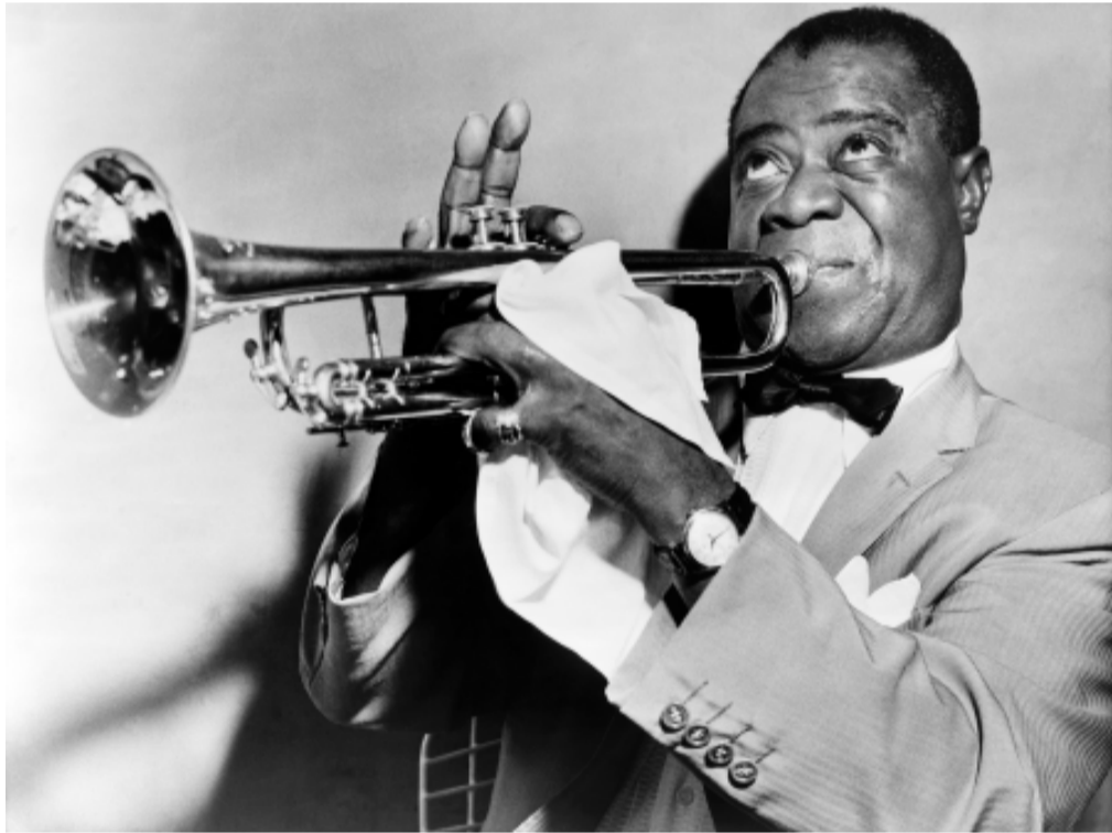
Louis Armstrong (1901-1971) is considered one of the pivotal musicians in jazz for his contributions as a trumpet player, composer and singer.