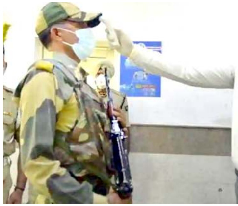
হোম কাৰিষ্টম তৌৱি।

ত্রিপুরাদা ৬সি কোভিদ-১৯গী অনৌবা কেস ১১ খেংনথি। ষ্টেট অসিগী তোঙান-তোঙানবা মফমদা ৬সি অনৌবা কেস ১৭ খেংনথি। হৌজিক ফাওবদা ষ্টেট অসিগী অপুনবা কেস ২৮২ খেংনথিবা লায়ননা এজিত কেস ১১০নি অমসুং নাৰুবদগী ফংলকপা মীশিংনা ১৭১ নি।