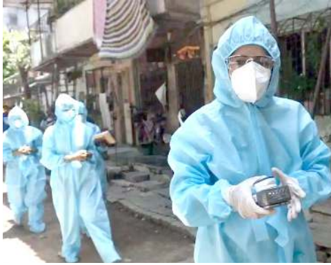
গুৱাহাতি, মে ৩১ (এজেসি):

অসামগী তোঙান-তোঙানবা মফমদা ৬সি কোভিদ-১৯গী অনৌবা কেস ৫৬ খেংনথিবাগা লায়ননা ষ্টেটকী অপুনবা কেস মশিং ১,২৭২ য়োরে। হৌজিক ফাওবদা মীওই ৪ কোভিদ-১৯না মরম ওইরগা শিগ্ৰে। অনাবা মীওই ১৬৩ দিনা লায়নথিবা ফাওবদা লুকুনা হোম্পিটালদৰ্গী দিসচাৰ্জ তৌপে।