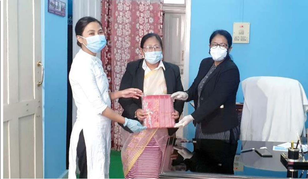
দিক্কাই এন্ড সেন্সন কোট কমপ্লেক্স যৌবালদা দিক্কাই লিগেল সার্ভিস ওয়াৰিটি যৌবাল অমসুং যৌবাল দিক্কাই বার এসোসিয়েসন শীপুনা দিক্কাই এন্ড সেন্সন জজ ওইনা থবক্কা পোখাৰী অৱিম নৌতুনেশেৰিব অচপা খুদোল পীদুনা ঠিকায়সুয়া উৰিবা