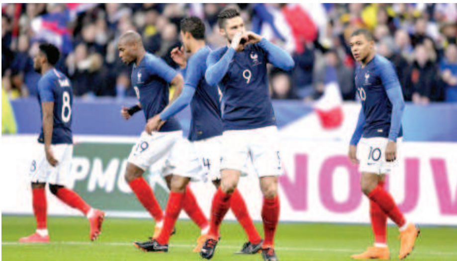
অজেণ্টিনাবু পাঞ্জল ৪-৩দা মায়থীবা পীদুনা ফিফা ২০১৮ বর্ল্ড কপ ক্বার্টর ফাইনেল যৌবা ওমদুনা ফ্রান্সকী শামরোয়িং

মোকো, জুন ৩০ (এজেসী) : ফিফা বর্ল্ড কপ ফুটবোল টুর্নামেন্ট ২০১৮গী টাইটল লৌবা ওমগনি হায়না মীয়ামগী অটোবা খাজবা অমদি শামরোয়িং অহানবা হোংনবা লৈখবসু ওইখি। মায়থীবা পীচগা পাঞ্জল ওইখোনা প্ৰী ক্বার্টর ফাইনেল মেচত অজেণ্টিনা অসিগী লীগ মেচশিংদা মেচ অমদা মায়থীদুনা লাকখিবা ফ্রান্স অমসুং শিনিংচিংতা লাকখিবা অজেণ্টিনাগী লম্বা তৌনথি।