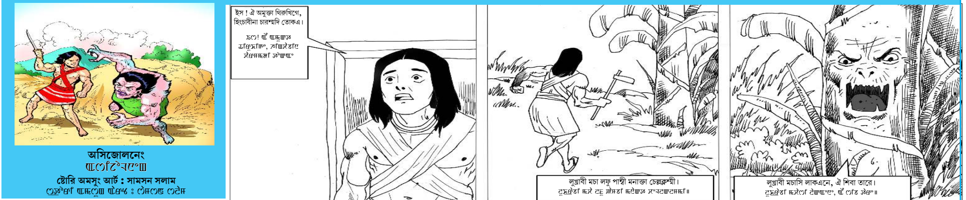
অসিজোলনেং... চৌৱি অমসুং আৰ্চ: সামন সলাম... লুৱাবী মচা লফু পাখী মনাতা ছেৱক্ৰম্মী।