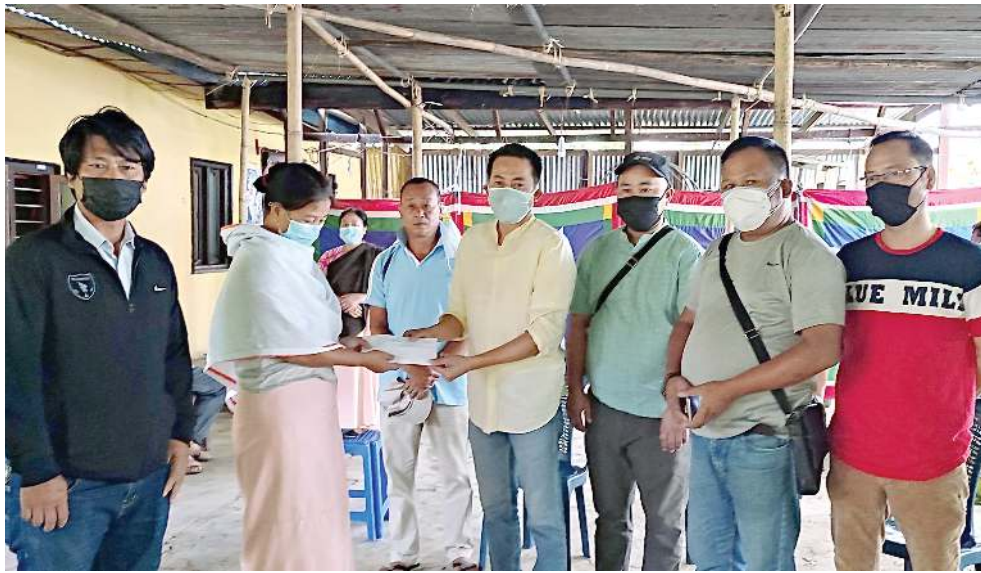
সং যিঞ্জিক যুনিয়ন (ৰাই পি এচ যু) গী মেনেজৰ ওইৱন্থা লৈখিব্ৰা কোন্সম জয়কিমনগী ইমুংদা মণিপুৰ ষ্টেট লীগ (এম এল এল) তা শৰুক যাবিবা টিমিংগী মেম্বৰশিংগী ইমুং মনুংগী অৱাৰদা শৰুক যাবিবাগা লোয়না শেল ওইনা লুপা ২০,০০০ তেংবাঙ পাৰিবা

কোহিমা, জুন ৩০ (এজেন্সী): আৰ্মদ ফোৰ্চেস স্পেসল পৱাৰ এণ্ট (অফস্পা) ১৯৫৮ কী মখালা সেন্দ্ৰনা নাগালেন্দা মখা তানা থা ৬ দিষ্টৰ এৰিয়া লাউথোকথ্ৰে হায়রি।