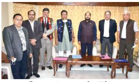
অমসুং অসামগী মৰজা গুৰুত্ৰে মৰী লৈননা উংখনবগী অদুগী ৰাৱৌশিং পুৰুৱা লৈবাক অনীগী চীফ সেক্ৰেটাৰি শিখাং মায়খংলক্ৰিবা থবকশিং য়ালা শিখাংনিঙাই ওই।

গুৱাহাটী/দিমাপুৰ, জুলাই ৩১ (এজেন্সী): অসাম অমসুং নাগালেন্দগী মৰজা গুৰুত্ৰে মৰী লৈননা চংয়েনবা কয়া লৈৰিবা অদুগী মতাংদা কা হেয়া উংখনবা খোৱক্ৰিঙৈ মাংওইননা ষ্টেট অনীনা গুৰুত্ৰে শৰুত্ৰে দিশ্ৰোয় তৌৰিবা ষ্টেট সিক্যুৱিটি ফোসশিং লৌথোকপদা য়ানত্ৰে হয়না নাকল অনীগী ওইবা জোইন্ট ষ্টেটমেন্ট অমদা ফোঙদোরক্ৰি।