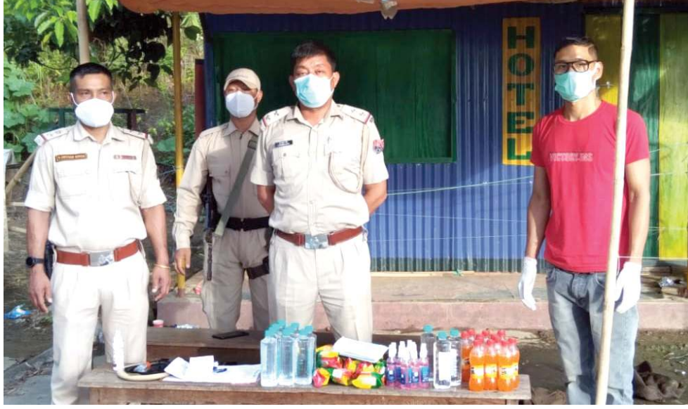
ইটিন কম্প্যুটাৰাইজ আই টেট্টিং এন্ড আই কোৰ সেণ্টাৰ খৌবালানা কোভিড-১৯ পেদমিক মৰজা ফ্ৰন্ট লাইন বাৱিৰ ওইনা থবক তৌৰিবা পলিস পৰ্শনেলশিংদা ফেস মাৰ্ছ, হেণ্ড সেনিটাইজাৰ অমদি চান-থৰুবা গুৰুমা পোংলমশিং মতেং পাংদুনা পুৰ্ণিৎ খৌগাংখিবা

আইজোল, জুলাই ৩১ (এজেন্সী): হৌখিবা জুলাই ২৬ তা মিজোৰাম অমসুং অসাম ষ্টেট অনীগী মৰজা লমগী রাহৌগা মৰী লৈননা থোকখিবা উংখনবগী খৌদোক অমদা অসাম পলিস পৰ্শনেল ৬ শিহনব্রবা মতুং ভূসি ফাওবদা অসামদগী মিজোরামদা পোং চৈ পুৰা গাডী অমত্তা চঙলক্ৰি হয়না ওখিসলশিনা ফোঙদোরক্ৰি।