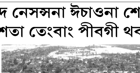
অসিদা বাংলাদেশতা খুদকী ওইনা মতেং পীবগী থবক থৌৱমশিং পায়খৎপা হৌবা তত্ত্বায়ফ্ৰে হায়না যুনাইটেড নেসনেল ফোণ্ডোক্কাৰে।

জেনেভা, সেপ্টেম্বৰ ৩০ (এজেন্সি) : বাংলাদেশতা থোকখিবা ঙ্গি শিং ঙ্গাওনা খুদোখিবা নংলবা লৈবাক অদুগী মীয়ামদা মীওইবগী মীনুংশি য়েংদুনা অথুদাম যু এচ ডেল্ভৰ মিলিয়ন ১৩৪ তেংবাং ওইনা পীনবগীদমক যুনাইটেড নেসনেল অমসুং মহাক্কা মপাশিঙনা হৌদোক্কাৰে।