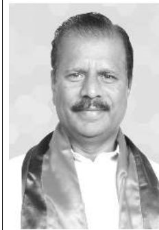
আইজোল, সেপ্টেম্বৰ ৩০ (এজেন্সি) : ত্ৰিপুৱাগী গভৰ্নৰ ইন্দ্ৰ সেনা ৱেদিদনা লাক্কাৰা গভৰ্নৰ ইন্দ্ৰ সেনা মিজোৱামগী গভৰ্নৰগী এদিসনেল চাৰ্জ পুবা হৌশ্ৰে।

হোৱা ফংফমগদৌৱি। মিনিষ্ট্ৰি না লৌখৎলক্কা বা খোণ্ডাথং অসিনা প্ৰধান মন্ত্ৰি ফসল বিমা যোজনা (পি এম এফ বি ৰাই)গী মথাদা ইন্সুৱেস ফংলিবা লৌমীশিংদা হায়বাবা পোলিসি দোক্কামেটশিং অসি শুংশোয় শোৱাদুনা ফংফমদা থোৱাৰে তৌৱি।