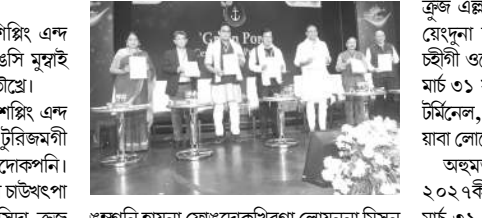
ক্ৰুজ এল্লাইয়েন্স শেদুনা কৰ্ম্মা মায় পাক্কাৰে য়েংদুনা চৰ্ভশিল্লগনি। অনীশুবা ফেজ্জদা মথং চহীগী ওষ্টেবৰ ১৬গী হৌৱগা কুম্ভা ২০২৭কী মাৰ্চ ৩১ ফাগওবগী মনুংদা ইন্দিয়াদী অমৌবা ক্ৰুজ টৰ্মিনেল, মৰিনাস অমসু ক্ৰুজিং অসিদা চপা য়াবা লোকেশন অমসু সৰ্ভিষ্ট শেল্লগনি।

মুহাই, সেপ্টেম্বৰ ৩০ (এজেন্সি) : যুনিয়ন মিনিষ্টৰ ওফ পোৰ্টস, শিপিং এন্ড ৱাটৰৱেজ সৱবানন্দ সোনোৱালনা ঙ্গস মুহাই পোৰ্টতা 'ক্ৰুজ ভাৱত মিসন' লোঞ্চ তৌশ্ৰে।