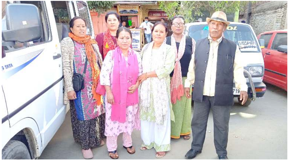
ওল ইন্দিয়াগী ওইনা হায়দৱাদতা পাণ্ডোৱাকুৰা মিদ দে মিল ৱাৰ্কৰিংগী কনফেৰেন্সতা শৰুঙা য়াৱনবগীদমক ইশ্বাল থাদোকুৰবা মণিপুৰগী টিম

মহাক্সা মফা তানা ফোণ্ডদোকুৰিবা, অসাম খন্তা নন্তনা মণিপুৰ, নাগালেণ্ড, ত্ৰিপুৰা, মেঘলায়া অমসুং অৰুনাচল প্ৰদেশগী মফম খৱদগীসু অফস্পা লৌথোকুৰে। চয়েনৰিবা লো অসিবু লৈবাক অসিগী অৱাং নোংপোক থংগা শৰুঙা লৈৰিবা ষ্টেটশিংদগী মণ্ড ফনা লৌথোকুৰখনিবা হোৱেনৰিবা মীয়ামগী মতুং মথৌ য়ায়া তাই। অমৰোমদা ষ্টেট গভৰ্ণমেণ্টনা খুলায় পায়দনা অৱানবা লইদা চংলুৰবা কয়বু হায়গী পুলি মইহিচা অমুক হমা পুৰুৱা হোৱেনৰিবা লাঞ্ছি। গভৰ্ণমেণ্টনা হোৱেনৰিবা অসিগী মতুং ওইনা নহা কয়া খুলায় থাদোকুৰা চঙজৰকুৰিবা লোয়ননা হায়গী পুলি মইহিচা হিংবা হোঁৱে। লৈজকী মায়কেন্দীসু মখোয়গী হিংবগী লই পীনা হোৱেনৰি হায়ৰি।