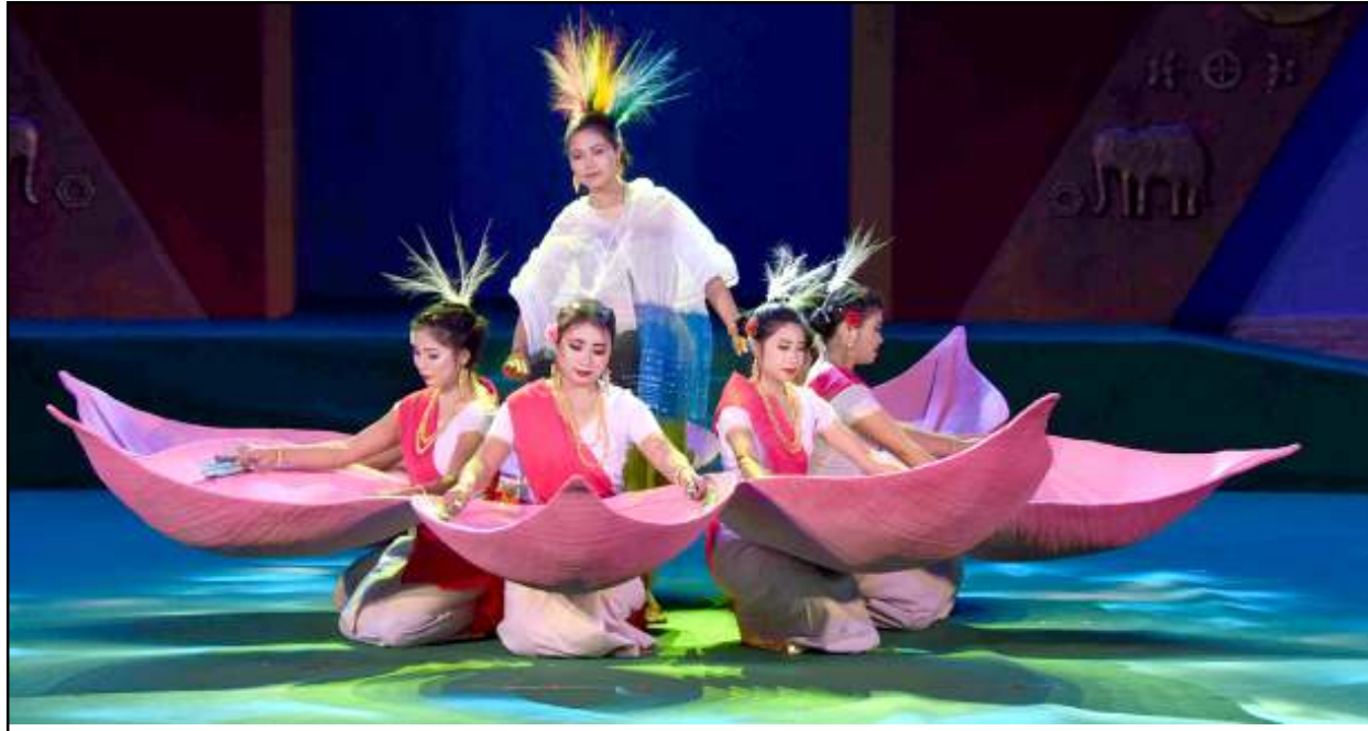
তাগাচন্দ্র ওপন এয়র থিয়েটারদা নুমিং ১০ নি চুপা চখরকপা সঙাই ফেটিভেল লোইশিনবনী থৌরমদা আটিশিংনা কলচরেল এলিভিটি উৎপা