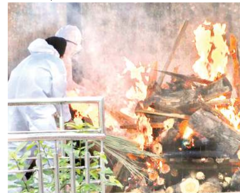
অনা থোকিবা ইমুং-মুংশিংদগী লৌহরিংদে। অদুৰ উপাই লৈব্রবা ইমুং-মুংগী মীওইশিংনা লৈত-

ডা. খাইদেম অখৌবা ইফাল, নবেম্বৰ ৩০ (এচ এন এস) : কোভিড-১৯না মরম ওইদুনা লৈখিদ্রবা মীওইগী অৰোইবা মথৌ-মঙম পাঙথোকুৰা মীয়ায় পেনদ্রে। আই এম সীনা লুপা লিশিং ১৫ লৌবগী থৌওং মায়কৈ কয়াদগী মীয়ায় পেনদ্রে।