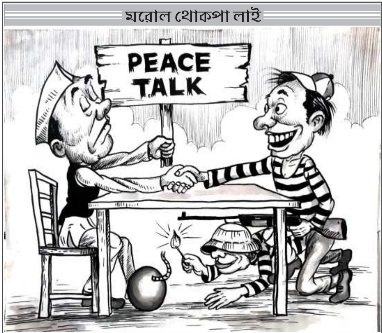
পাউচ অসিদা ফোঙজরিবা রাংগেংশিং অসিগী রাখল, মীংয়েং অইবা মশা মশাগীনি। পাউচ অসিগী রাখল্লোন অমসুং মীংয়েংগা থোইদোক্কা মরী লৈনদে।

ঐথোয়না য়ুমদা থানরিবা চেঙ্গুম অয়ান্না চাং নাইনা চাবদা কামবা গুজ্জনি। অদুগা কৈথেলদা য়োল্লিবা নংত্রগা লমলজা হৌরবা চেঙ্গুমদি মশক মুমা খঙদ্রবদি চাবিক্কা। চাভ্রবসু য়াবা চেঙ্গুম চারগা অশি-অনা নংগদৌ শরুক ইশানা ইশাগী য়ুম, ইঞ্জোলদা থারগা চাবীয়ু।