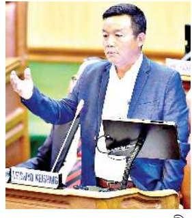
মঙলান অমসু মঙফাওনরগদ্রা হায়বগী খাজবা লৈরে।

ইম্ফাল, মার্চ ০১ (ঐচএনএস) : মমাঙ চহীগী মে ৩দগী কুকি লমহেনবশিংনা মীতৈদা ওনশিন্দুনা অতন্ননা তমখীরবা লান চখরকপদা মপুং ওইবা খৌদাং লৌরকিবা কুকি মিলিটেটশিংগা মণিপূর অমসুং ইন্দিয়া লৈঙাক্কগী মরজা তৌনরকিবা 'সু' লৌখোক্রবা মীয়ালা অকনবা দিমাদ তৌনরকপদগী ওরাংগী মীফমা রাফম অসি থবতা ওহেঙ্কগীনবা যুনিয়ন লৈঙাক্ক তকশিয়ারবী বারোপ লৌখিবা মতুংদা ওসিগী মীফমদনা মণিপূরদা নেসনল রেজিষ্টর ওফ সিটিজন (এন আর সী) চৎনহন্নবীনবা বারোপ অমুক লৌখিবানিবা মীয়ামগী