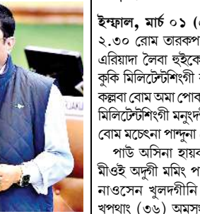
নোংমৈ কাপ্পে হায়বগী প্রফ লৈতে, এস পিগী রিপোর্ট মতুংইনা মহাক পেত্রোলিং চলেইত্তে লৈখিবনি। লৈঙাক্কী ওফিসল ওইবা রিপোর্ট লৌবা তাবনি হায়রদনা এম এল এ কন্সমুলে ওইবা রাফম ফেঙদোকই হায়না ওনশিন্দুনা চার্জ তৌরদুনা এম এল এ মশানা মে ৪দা পিছ কয়ামি শেয়ুদগী শুন্তু ... মখা লমায় ৩ কলম ৪