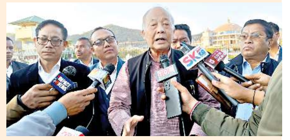
সন এম এল এ, কে রঞ্জিতনা মখোয়গী মহাক্ক হায়, হাউসকী রুলস ওফ মায়কৈদগী এম এল এ মরিনা হাউসতা মতুংইনা প্রাইভেট মেম্বর রিজোলুসন অসি সেশন চখা নুমিংশিংগী মনুংদা ইরাই নুমিং খন্তনা ... মখা লমায় ৩ কলম ৬

ইম্ফাল, মার্চ ০১ (ঐচএনএস) : চখরকিবা মণিপূর লেজিসলেটিভ এসেমব্লিগী মমাঙশুবা সেশনগী ওসি হন্নি চক্কপদা ওপোজিসন এম এল এশিংগী মায়কৈদগী হাউসতা পুথোক্তনা খননবগীদমক মুত তোখিবা প্রাইভেট মেম্বর রিজোলুসনশিং অমতা লৌখৎপীরক্তে হায়না ওপোজিসন মেম্বরশিংনা স্পিকরদা বাকৎলকপদগী চরাংনবা থোরজুনা ওপোজিসনগী এম এল এ হাউসতগী মপান থোক্কা ওপোজিসন লৌবিদা য়ানীংবদা ফেঙদোকত্রে। ওসিগী মীফমদা এম এল এ লেসিও কেসিংনা মণিপূরদা এন আর সী চৎনহন্নগবী বারোপ লৌখিনা প্রাইভেট মেম্বর রিজোলুসন পুথোরকপগী মমাঙইননা ওপোজি