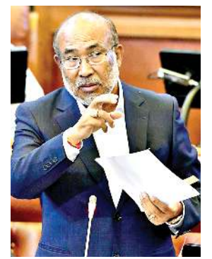
'মীতৈদা লান্দাৰা পুলিস সস্পেন্দ তৌরকপী চুড়াচান্দপুর মহাভারত ওনখে, মুচ ... মখা লমায় ৩ কলম ১

'ঈরাং হোয়া চাউথোকহনখিবা রাইশিং সোসল মীদিয়াদা থাগৎলকপা এম এল এ পাওলিয়নলাল হাওকিপকী মখতসু লৈঙাক্ক কেস লৌখৎতনা থিজিমা হোংনরি'