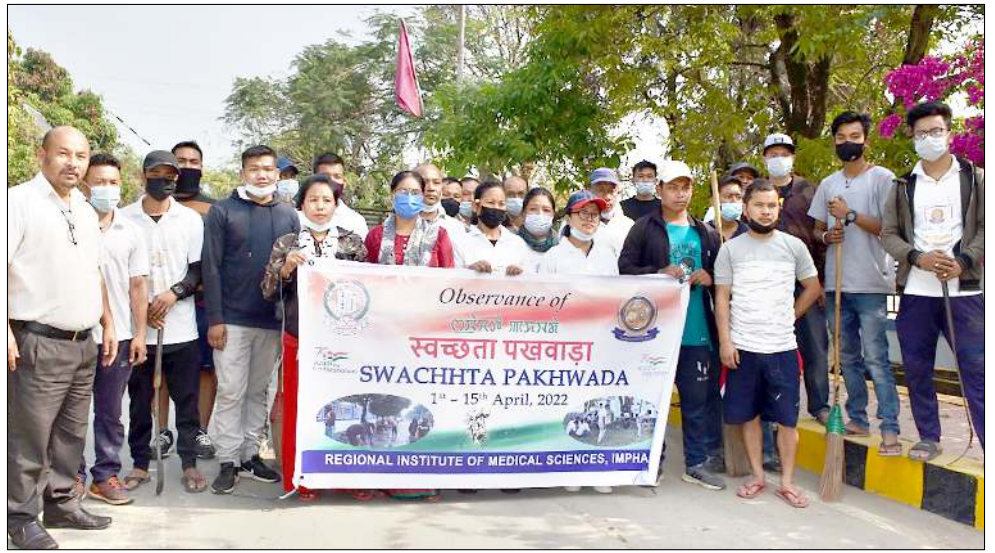
চয়োল অনী চুপা পাঙথোক্কা স্বচতা পাস্থাৱা কেম্পোন ৱিজনেল ইন্সটিটিউট ওফ মেডিকেল সাইন্সেস (ৱিমস) ইম্ফালাদা হৌদোকখিবা

পনবা যাবদি, কৌনৱাদ সংমানা মহাক্কী অসামগী কাউন্সিল পাট হিমতা বিখাগা মাৰ্চ ২৯ দা এপ্ৰিমেণ্ট সাইন তৌনৱিবা অসিগী ষ্টেট অনীগী চয়েংনৰিবা ময়ম ১২ গী মনুদা তৰুক - টৱাবৰি, গিজাং, হাইম, ৱোকাপাৱা, খানাপাৱা-ফিলংকাটা অমদি ৱাটাচোৱা অহানবা ফেসকী ওইনা সেটেলমেণ্ট পুৰকপা গুগুগনি হয়ৱি।