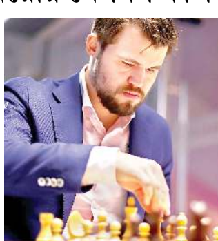
থোইবা গুমদুনা টাইটল অদু লৌবা গুমথি। অরোইবা রাউন্দ অদুনা মেগনস কার্লসন অমসুং যু এস এগী রেপিড শোনা রেপিড গেমদা হো

ন্যু দেব্লী, জুন ০১ (এজেন্সী): ন্যু এস দোব্লর ২২০,০০০গী শেলগী মনা লৈবা এফ টি এক্স ক্রিপ্টো কপ ওনলাইন রেপিড চেছ টুর্নামেন্টকী গুৱাং অথংবদা লেইশিনখিবা ফাইনেল রাউন্দদা বর্ড নম্বর বান ওইরিবা নোরবেগী গ্রান্দমাস্টর মেগনস কার্লসনগী ফজবা মশাগনা টাইটলগী অচৌবা মঙলন মঙলন্যু এস এগী শাররায় রেপিড শোবু মায়খীবা পীদুনা টাইটল লৌবা গুমথ্রে।