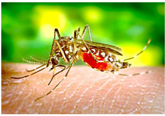
অমসুং হায়গী কেমিকল অমসুং রেডিয়েসনা পুথোকপা স্টেরাইল ওইবদা কাঙশিংগা মায়াদবা মওংদা কাঙশিংগী মশা-মউ ফনা লৈ।

কাঙ হায়বা জীব অসি ঐথোয় মীওইবদা অয়েংপা পীবা, নুংঙাইতবা পোকহনবা অমসুং লায়না কয়া নাহন্দুনা অশি-অনা কয়া থোকহনবা জীবশিংগী মনুংদা অমনি। কাঙনা মীওইবদা লায়না থোকহনবা মহীক কয়গী ভেক্টর ওই।