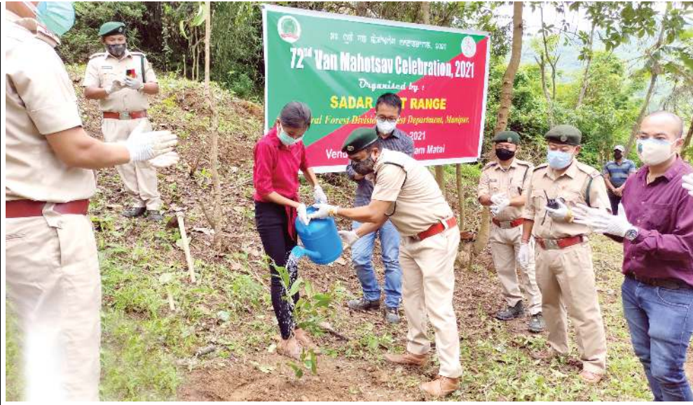
৭২ শ্ৰাবণ মাহেটসভ সেলেব্ৰেচন ২০২১ (উমংগী কুন্সে) খৌৱমগী শৰুক অমা ওইনা সেল্লেট ফোৰেষ্ট দিভিজন মন্ত্ৰিপুত্ৰিগী মীংয়েং মখাদা সদৰ ইষ্ট ৰেঙ্কনা শীন্দুনা লুৰাংশবম মতাইদা পাঙথোকথিবা উ চৰা থাবনী খৌৱমদা শৰুক য়াখিবিশং