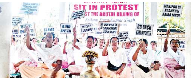
৮ লোম তারকপদসু বোরোবেত্রা সব দিভিজনগী প্রেমচান্দ কৌবা মীওই অমগী যুম মৈ থাদেক্সে। মনুং চনবা জকুরাধোর পাট টুনা লৈবা হৈহাম

সোইবম সরতকুমার হাংখিবা মীহাংপশিং ফাগদবনি হায়দুনা দিবোং খুনো কম্মুনিতি হোলদা বাকং খোঙজং চঙশিনশ্বে