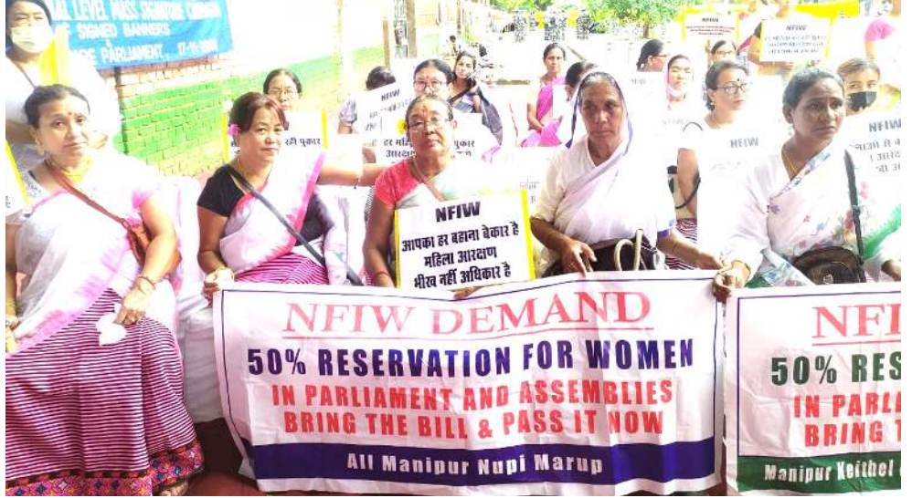
নুপীগীদমক পালিয়ামেণ্ট অমদি এসেমীল্লা চাদা ৫০ কোটি থলুবা দিল্লীগী পালিয়ামেণ্ট মানত্ৰা লৈবা জল্টর মন্দিরদা লমদম অসিগী নুপীশিংনা প্রোটেষ্ট চথবা