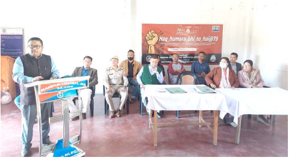
মসলসানা শিন্দুনা মণিগুৰ সেম্বেল জেল শজিৰা অমসুং সেম্বেল জেল ইফালদা পাঙথোকখিবা হক্ হমরা ভিত্তি ৭৫ দা শৰুক য়াখিবাং

মথং চহীদা পাঙথোকুদৌৱিবা ত্ৰিপুরা ষ্টেট এসেমব্লি ইলেক্সনগা মাঙওইনা বি জে পিগী বার্করশিংগী ওপোজিসনদা লৈৱা পাটিশিংগী বার্করশিংগী এটেক চত্ৰক অমদি ওফিসিং থুগায়বগী থৌওংশিং তোয়না চত্ৰি হায়না কোংগ্ৰেসনা মৰাল শিৱকপগা লোয়ননা পুলিনা এজ্ঞন অমতা লৌখন্তা লৈৱি হায়নসু পেন্দবা ফোঙদোরকি।