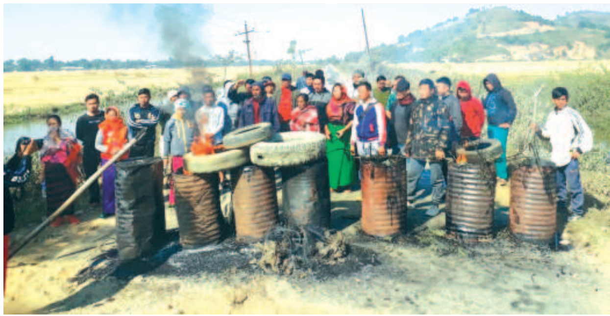
মণিপুর লৈজাক্কা মতম শাংনা লম্বী শৌধীৰজবদগী খোইনাওনৰবা মীয়াম্মা ইফ্ফাল-য়াইৰিপোক লম্বী থিংজিন্দুনা খোঙজং চঙশিনবগী শক্তম