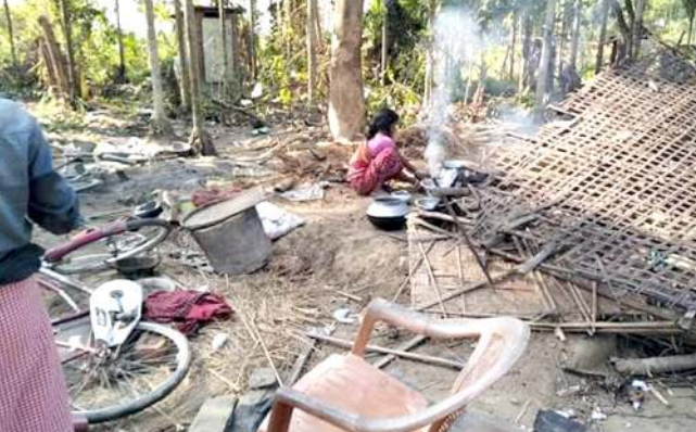
তামলপুৰ, দিসেম্বৰ ০১ (এজেন্সি): অসামগী বাক্সা দিষ্ট্ৰিক্টকী তামলপুৰ সব-ডিভিজনগী মনুং চনবা নাগ্ৰিজুলি এৱিয়াৰা খুঞ্জাশিংগা শামু লমশাশিংগা মুৰব্বীগী যৌদোকৈশিং হৌজিক্স লেণ্ডনা থোক্তি। হৌখিবা ইৱাই নুমিত্তা অহিৎদা ইন্দ্ৰো-ভূটান বোৱাৰদগী লাকপা শামু লমশা শল্লপ অমা

নাৱায়নপুৰ তিলেজনা চঙলভুনা অহিং চুপ্পা অমাও-অতা কমা থোকহনখি। শামু লমশাশিং অদুনা পুনা য়ুম ২৫ মপুং ফানা মাও-তাকহনখিবাগা লোয়না খুঞ্জাশিংনা পৈদনা থলিবা ফৌসুচাথোকৈখি। শামু লমশাশিংনা নৈবদুনা খাওবা গুমজৰা খল অদুগী মীওইশিং ময়ুম-মকৈ থাদোকুনা