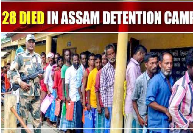
গুৱাহাতি, দিসেম্বৰ ০১ (এজেন্সি): অসামগী দিটেন্সন কেম্পশিংদা তোঙান তোঙানবা লায়নানা নাদুনা শিখিবা মীওই ২৮গী মনুংদা শুপ্ৰগী মীওই অহুমদি বাংলাদেশতগীনি হায়না অসামগী পাৰ্লিয়ামেণ্টৰি এফেয়াৰস মিনিষ্টৰ চম্ৰ মোহন পাতোৱাৰিনি ফোঙদোকৈছে।

মহাক্কা ৰাফম অসি থাংজ নুমিত্তা ষ্টেট এসেমব্লীদা অসোম গন পৰিষদ (এ জে পি) গী এম এল এ উপাল দন্তনা হংলকখিবা ৰাহং অমগী পাউখুম পীৱদনা ফোঙদোকৈখিনি।