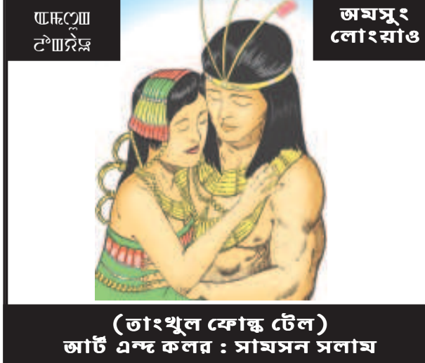
(তাংখুল ফোক্ত টেল) আট এন্ড কলর : সায়াসন সলাম