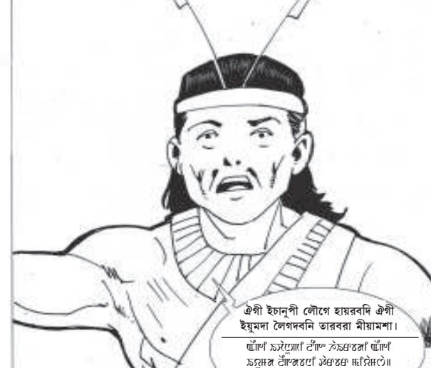
এগী ইচনুপী শৌপে হায়রবনি এগী ইয়ুদা পেপাবনি ভাবৰা মীয়ামশা।