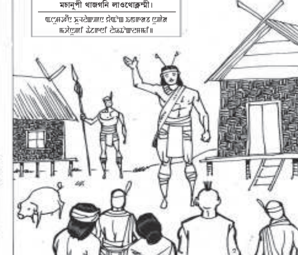
অসুতৌনা খুগাপনা য়াং ইমদপদা নুপা মচনুপী খাজনি লাওথোকপা।