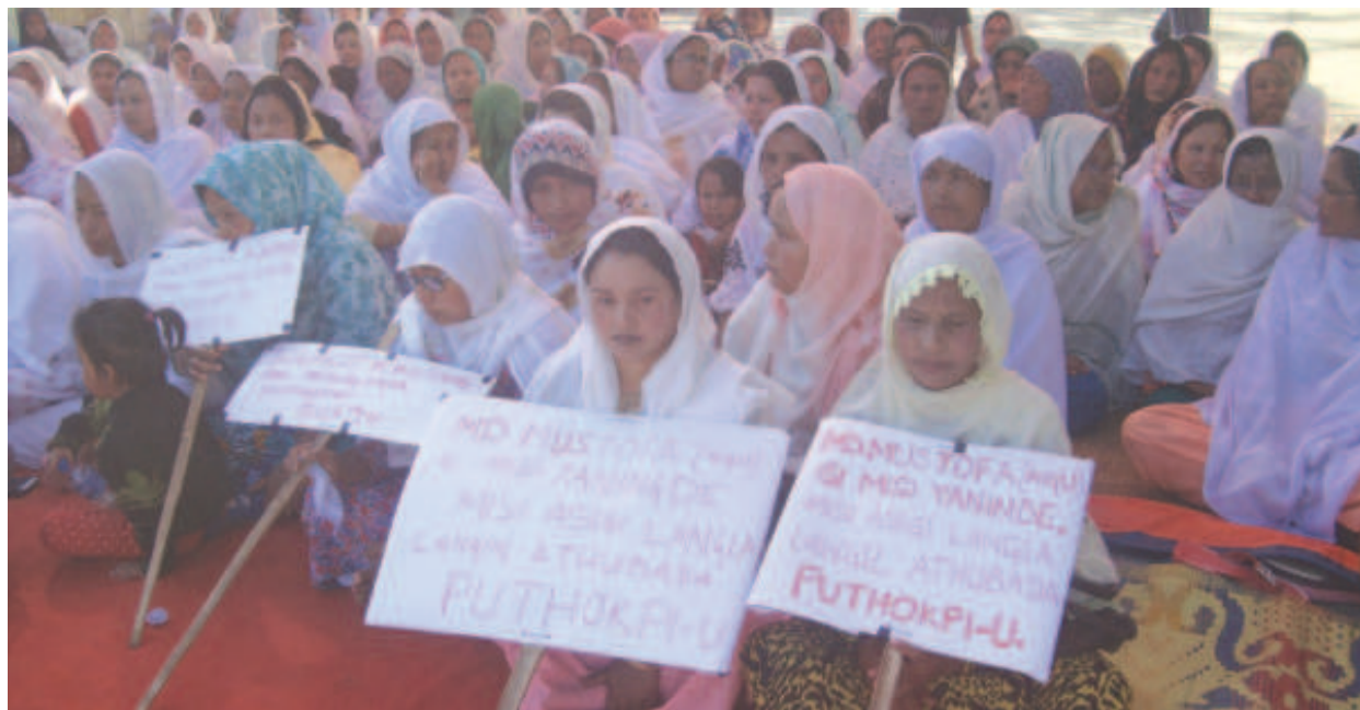
ইম্ফাল ইষ্ট দিক্টিক্কী ক্ষেত্রি মখা লেকাইদনী এম দি মট্রোফা কৌবা মীওই অমা খৌরি য়ান্দুনা শিরহুগী মতাংদা চেমবশিং পুথোকউ হায়না বাকৎ মীফম ফহা

ট্রায়েংফো/খোং হায়না মতম কুইনা চঙবা, খোঙ হায়না চাং নাইদবা, অমাংখোং ময়াদা মখুল অনী ছংলগা নাই চারকপা, অমাংখোং ময়াদসু পোমথোকগা লেবা, মরক মরজা খোঙ হায়না দৈ দ্রোপ দ্রোপ তারকপা, শা-ঙা চাবা যাদবা ফহনবগীদমক স্টেট অমদি নেসনল এবাদ ফংলবা ওজা জিয়া উল হকপু খাগংচরি