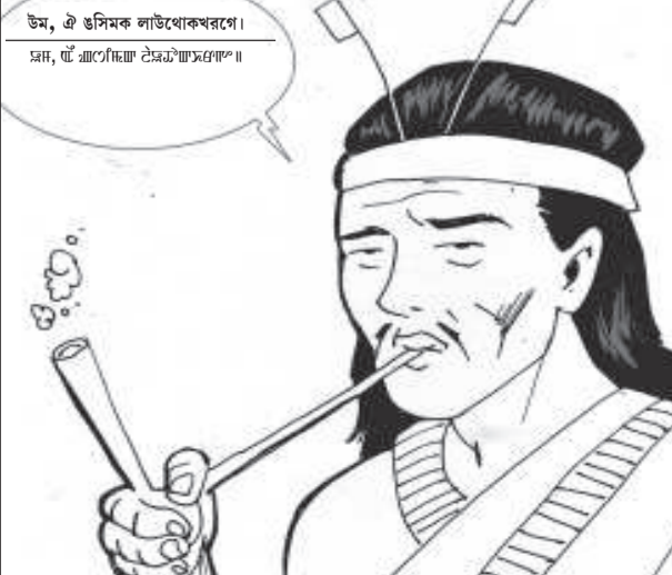
উম, ঐ উমিক লাউথোকখরমে। হম, ঐ হমকোলা টেমহামসংগে।