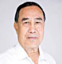
ইম্ফাল, মার্চ ০২ (এইচএনএস) : হৌখিবা মে ওদগী চু ডা চান্দ পুৱদগী হৌরকখিবা তমখীরাবা লান লেপ্তনা চখরকপসু মণিপুর অসি মপু পান্দবা, লো লৈতবা অমম্বা লমদম অমা ওইরকপদগী ঐখোয় মশেল ফাওবা শক খঙদান্দা য়েব্ববনি হায়দনা খন্নরকপগী ফীভমদা লাক্লে। ওইরকখিবা ফীভম অসিদি ষ্টেট অসিগী পুৱরিদা অদুমক নীংশিখুনা তেইহৌরগনি হায়রি।