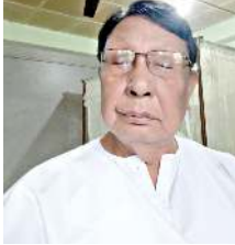
ইম্ফাল, মার্চ ০২ (এইচএনএস) : হৌখিবা চহীগী মে ওদগী লেপ্তনা চখরকখিবা লান অসি লোইশিনবগী বারোইশিন পুরকপগী খৌদাং ষ্টেট অমসুং যুনিয়ন লৈঙাক্তি ওইগদবনি। মরম অসিনা কস্টিটিউশনেল ওল্লিগেসন খরদগী হৌজিক চখিবা এসেমল্লি মীফমদা লান অসিগী বারোইশিন পুরকপা পাইশ্রে অমা হাউসনা খন্নরগা লেপথোক্লেবনি। মসি নংগ্রাদি মীয়ামা লৈঙাক অমসুং মীফমগী রাহস্থোক চপ চনা ফবা ওল্লিই হায়না লো মিনিষ্টরসু ওইরকপা ভেটরেন পোলিটিসিয়ন ওক্রম জয়না পাউচে অসিদা ফোঙদোরক্লে।