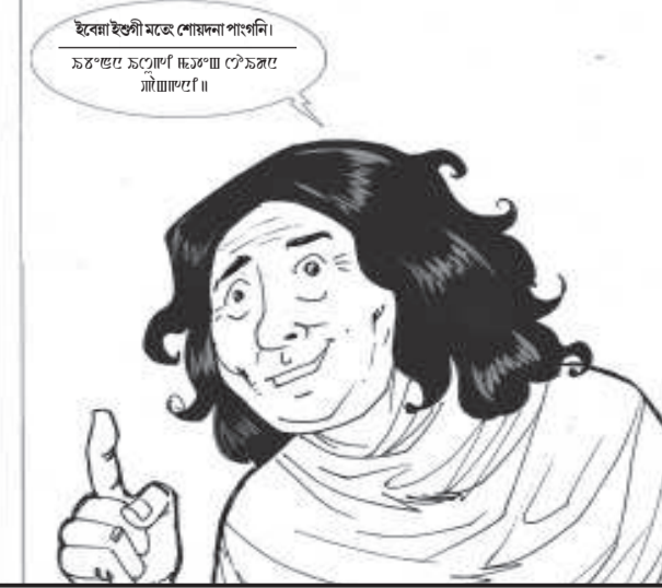
ইবেক ইবেকগী শোকনা পালেদি