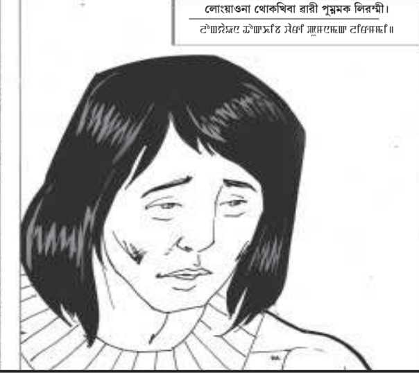
লোয়ান্ডা থোকখিবা হারী পুম্মক লিরশী