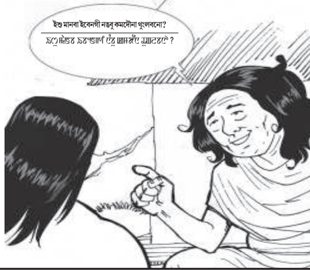
ইতু মনবা ইবেকগী নঙু কমেদোনা থুংলরোনা?