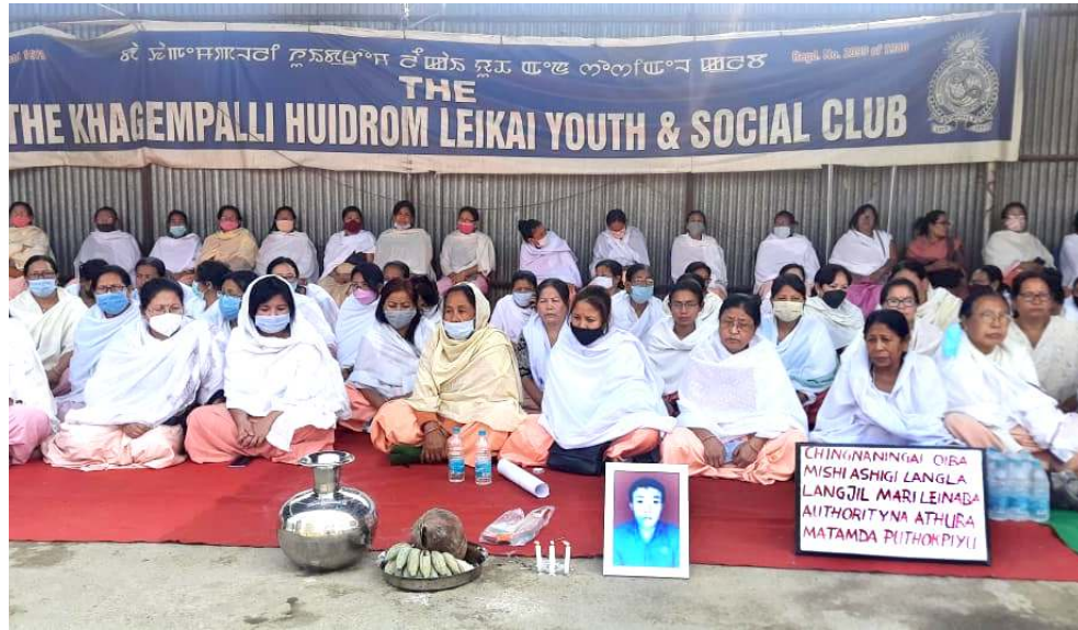
মমাং থাগী ৩১ দা শমুৱৌ অৱাং লৈকায়দা লুংহোং য়াওনবদনীমক চেংবিবা খাগেমপল্লি হুইদ্রোম লৈকায়দী হুইদ্রোম ইমো থা অসিগী ১ দা শিনা ফুংবিবা অদুগী মতাংদা অশেংবা লংলা লংজিন অমা পুথোকলবনি হায়না তকশিন্দনা খাগেমপল্লি হুইদ্রোম লৈকায় কন্মিয়নিট হোলদা মীয়ান্না ৰাক্ৰে মীফম ফমবিবা

গুৱাহাটী, এপ্রিল ০২ (এজেন্সী): অসমগী কৰিমগঞ্জত বি জে পি এম এল এ অমগী গাভীদা ই ডি এম মেছিন পুথোক পুশিন তৌৱদা থেংনবদনী পোল্লিং ওফিসল মরি ইলেঙ্কন কন্মিসন ওফ ইন্দিয়ানা সস্পেন্দ তৌখ্রে হায়রি।