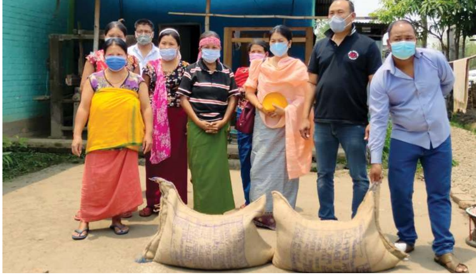
রাংখেম এসেমব্লি কমিটিয়েলিগী মনুং চনবা চরাংপাংকী তোঙানবা তোঙানবা মফমশিংদী খনগংলবা কোভিড-১৯ না মরম ওইদুনা শুফম নোশফম লৈত্ৰবা ইমুংখিং অমদি দিস-এবল পার্সনশিংগী ইমুংখিংদা কমিটিয়েলি অসিগী হায়নী মীৰেপ কে য়ুমুগিনা ত্ৰেংবা পোংলমশিং য়োহোক্খিবা

লোয়ননা মহাক্কী হকচাংগী ফীভম খুদোংখিনিংগ্ৰাই ওইহি। মরম অদুনা মীয়ান্না পায়খংখনিংগ্ৰাই ওইহি হায়রি। মহাক্কী ফোঙদোক খিবদা এণ্ডোদা কোভিড-১৯ নারস্না যাই চিনহনবা অচনা খুদম খরা ফলবা মতুং মহাক টেই তৌখি। মদুনা মহাক পোজিটিভ ওইৰেগী মরম ওইৰেগা হৌখিবা নুমিং খরনি অসিদা মহাক্কী লোয়ননরস্না মীওইশিংনা কোভিড-১৯ টেই তৌখোৰুবা অমদি মখোয় মশানা খঙনা হোম আইসোলেট তৌনবা আপীল তৌরক্ৰি। অমরোমদা গভৰ্ণৰ গঙ্গা প্রসাদক্কী লোয়ননবী অমদি সিক্কিমগী ফাষ্ট লেদিসু ওইৰিবা কমলা প্রসাদ কোভিড-১৯ রিজ স্টা নেগেটিভ ওইৰেগ্লে। সিক্কিমদা কোভিড-১৯ শব্দোকপগী মশীং হক্ৰুভনবা মরম ওইৰেগা গভৰ্ণমেট ওফিস অমদি পল্লিক সেক্ৰেটশিং নুমিং ৩ খিঞ্জিবনা খঙনত্ৰে।