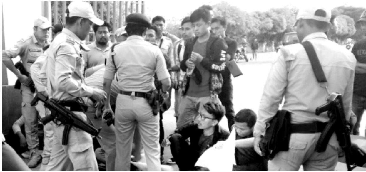
মণিপুর যুনিভার্সিটি ডাইনেচালার মফম লৌকোকেউ হায়দনা খোঙজং চঙশিল্লকখিবা মহৈরোইশি পুলিসনা তানখাইবগী শভম