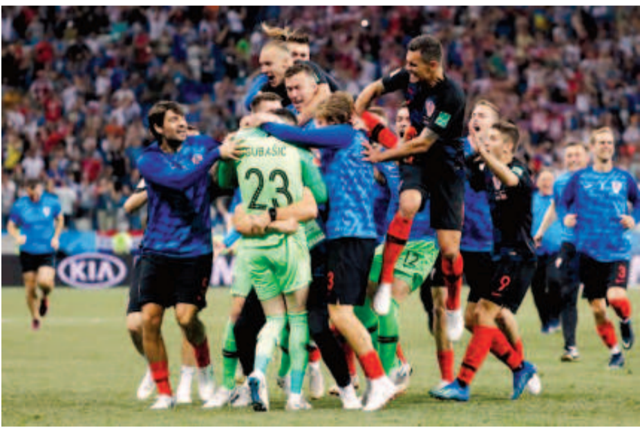
দেনমার্কী পেনালটি সোট অহম ঙাকথোকপা ঙমথিবা ক্রোসিয়ানী কিপৰ সুবাসিকপু টিমমেটশিংনা হৰাউদনা কোনশিনবা

মোছো, জুলাই ০২ (এজেন্সী) : গুৱাং অথেন্বেদা লেইশিনথিবা ৰসিয়া ফিফা ৱৰ্ল্ড কপ ২০১৮গী শ্ৰী কাৰ্টৰ ফাইনেল মেচ অমদা ক্রোসিয়ানা দেনমার্কপু পেনালটি শুট আউটত মায়থীবা পীদুনা কাৰ্টৰ ফাইনেলদা য়ুৰু ৰসিয়াগা লন্থা তৌনৰগনি। ঙসি শালথিবা অতোপা শ্ৰী কাৰ্টৰ মেচ অমদা মেক্সিকোগী ৱৰ্ল্ড কপ অসিদা কাৰ্টৰ ফাইনেল য়ৌবগী ল্বেল অদু ব্ৰাজিলনা থদংখ্ৰে।