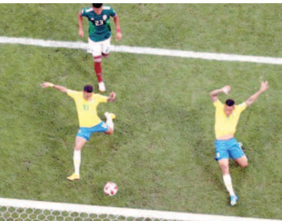
মেক্সিকোগী মায়োজা অহানবা পাঞ্জল চনবা ঙমথিবা ব্ৰাজিলগী নেমাৱনা গোল পোষ্টত্ৰা বোল কাওশিমবা হেংনবা

ক্রোসিয়ানী ক্ৰামাৱিক অমসুং দেনমার্ককী ক্ৰায়ৰ পাঞ্জল চনথি। অহমমশুবা সোটশিং কাওনথিবদসু ক্রোসিয়ানী মেট্ৰিক পাঞ্জল চনথি। অমৰোমদা দেনমার্ককী ক্ৰোন দেলিসু পাঞ্জল চনবা ঙমথি। পাঞ্জল ২-২ মায়ৰবা মতুং মৰিশুবা সোট ক্রোসিয়ানা হাৰা কাওবদা পিবালকী সোট পাঞ্জল ওইবা ঙমথিদে। দেনমার্ককী মায়কৈদগী স্কোনগী সোট পাঞ্জল ওইথিদে। মঙাশুবা পেনালটি সোট ক্রোসিয়ানী মায়কৈদগী ৱাক্ৰিকনা কাওবদা পাঞ্জল ওইথি। অদুগা দেনমার্ককী মায়কৈদগী কাওবকথিবা এন জেগেনসনগী সোট অদু ক্রোসিয়ানী কিপৰ দেনিএল সুবাসিকনা ঙকথোকপা ঙমদুনা পেনালটি শুট আউট অদু ক্রোসিয়ানা দেনমার্কপু ৩-২দা থোইৱগা কাৰ্টৰ ফাইনেলদা ৰসিয়াগা থেংনগাৱেৱিৱনি। সমাৰা সিটিনা লৈবা কোসমোস এৱেনাদা মীওই লিশিং ৪২ ৱোল্ল মিংয়েং তাথিবা ব্ৰাজিল অমসুং মেক্সিকোগী মেচ অদু হৌৱকপদা মেক্সিকোনা বোল হেৰা পায়বা ঙমথি।