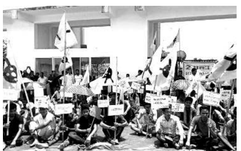
২০ গী ওইনা তোঙান তোঙানবা কোসতা অহানবা সেমিষ্টৰগী মিং চনবদা শেল হোমা লৌবা মৱম্মা হৌজিক ফাওবা মইহেৰোয় অয়াৱা মিং চন্দনা লৈৱি। শেল-থুমগী অৱাৰা মায়াৱল্লৱা ইমুংগী মইহেৰোয়শিং মিং চনবনবগী মখতা ইনাক খুনবা ইমুংগী মইহেৰোয়শিংদা হোমা খুদোংচাবা পীৰগী যৌওং য়ানিংদে। ইন্সটিটিউটা ট্ৰাইবেল মীয়াম, মৰু ওইনা বি টি এ দি ৱিৰ্জনা লৈৱিবা মী ওইশিংদা হাৱা খুদোংচাবা ফংহনগদবনি হায়নসু এ বি এস য়ুগী লুচিংবশিংনা ফোঙলোকখি।