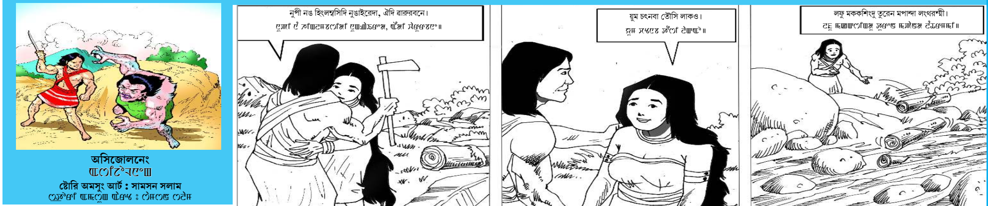
অসিজোলনেং... টৌৱি অমসুং আৰ্ট: সামসন সলাম

মিট্ৰন পোষ্টিং তবা বৃগেদিয়র বিকাশ সন্মালয় কোভিড-১৯ পোজিটিভ ওইৱে হায়বা ৰেক খঙলকপগী অলিপুৱদ লৈবা ৰফাল হোম্পিটালদা পুখংতনা লায়খি।