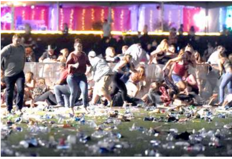
নেংশিমবদা মীওই ৫০০ গী মথক্তা অশোক-অপন নংখ্ৰে। সূঁৱ অদুস শিখ্ৰে অমসুং মথা শাংখ্ৰনা অকিবা পীবা লৈৱ্ৰে হায়না লোৱাৰ্দেদা মথা তাখি।

লাস ভেগাস, ওক্টোবৰ ০২ : যুনাইটেদ ষ্টেটসকী অনৌবা পুৱাৱীদা নোংমৈ কাপুনা পাভ্ৰুনা মী হাংপগী ষ্বাইদগী শাখীবা খৌদোক্তা ওৱাং অহিং গনমেন অমনা য়ামভ্ৰবদা মীওই ৫৮ হাংখ্ৰে লাস ভেগাসকী কন্সৰ্ট অমা ফিল্মিং ফিল্ড ওল্হোক্ৰে। মন্দলে বে কসিনোগী মনাত্ৰা থোকথিবা খৌদোক অদুদা মীওই ৫০০ ৰোম অশোক-অপন নংখ্ৰে হায়না এ এফ পিনা পুলিসকী ওফিসলশিং পল্লদুনা ফোঙদোক্ৰি।