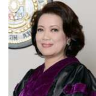
এহাক্কা য়াওনা লাইৱিক পুশ্বা হাংদোক্ৰুনা অচুস্মা য়েংনসি হায়না দুট্টেটা ফোঙদোক্ৰি।

ইলিগল ওইবা অমসুং ইমপিচ তৌনিওই ওইবা অমত্ৰা তৌখিদি।