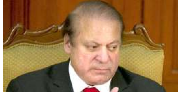
হন্দক্তা ইলেভন বিল ২০১৭ পাস তৌখিবা হান্নগী প্ৰাইম মিনিষ্টৱ অদুনা পি এম এল - এন অমুক হনু পায়বা য়ানবগী লম্বী ফাংখিবনি।

নৌহৌননা থাজবা থল্লগী ৰিজেলুশ্বন অমা পাস তৌখি হায়না পাকিস্তানি মীদিয়ানা ফোঙদোক্ৰি।