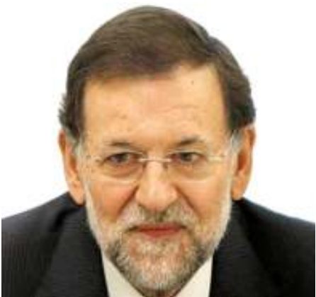
মৰুওইবা মল্টিনেলেলশিংগী প্ৰদৰ্শন বেজ অমা ওইবদা নংতনা য়ুরোপকী ষ্বাইদগী প্ৰোথ ৰাংবা সিপ্লি পোৰ্ট অমনি।

বাৰ্সিলোনা, ওক্টোবৰ ০২ : কাটালোনিয়াদা নোংমাইজিং নুমিৎতা পাভ্ৰথোকথিবা ঈৱাং কয়া থোকথিবা নীংতস্থগী ৰেফৰেন্দমনা স্পেনগী ষ্বাইদগী ইনাক খুল্লবা লমদম তোঙাৱা তানবগী লম্বী ফাংখিবগা লোয়ননা ডিক্ৰেদ কয়গী মনুংদা প্ৰাইম মিনিষ্টৱ মাৰিয়ানো ৰাজোয় স্পেনগী ষ্বাইদগী চাউবা কনষ্টিটুশ্বনেল ক্ৰাইসিস মায়েক্কৰক্ৰে।