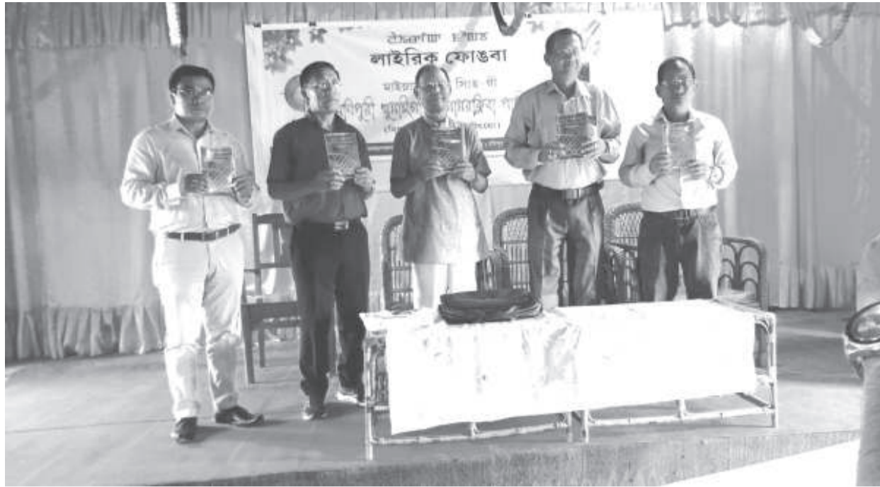
মাইয়াম ভাৰতনা ইবা মণিপুৰী খুন্সাইগা শাগোৱৰক্ৰিয়া পাহীশিং হায়না মীংখোনবা লাহীৰিক অমা মণিপুৰ হিন্দী পৰিষদকী হোলদা ফোঙবগী শত্ৰু

টোপ্ৰমেণ্ট/অমাঙথোং ময়াদা কাকফৈ অমনবঙলা লেবা, খোঙ হায়দা যাদবা, খোঙ হায়দা মতম কুইনা চংবা, পুজা য়েৰুগা খোঙ হাল্লিংলগতা লেবা, অমাঙথোং মনুংদু পোয়া, অমাঙথোংগী অকোয়বদু মৱেং মৱেং চংলগা হাক্ৰংচবা, হাক্ৰংচবা অদু খোংপা মতমদা অমাঙথোং চাউখংলকপা ফহনবগী ওজা জিয়া উল হকপু থাগংচৱি