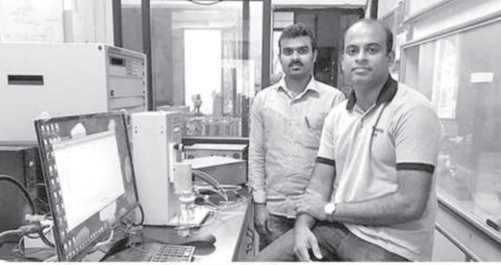
জে এন সি এ এস আরগী দাঃ সেবাস্টিন পিটর (য়েৎ) অমসুং রজামনি

দোপামাইন হায়বসি ন্যুরোত্রান্সমিটর হায়না খঙনবা কেমিকেল অমনি। মসিনা থোপ্তা য়াওরিবা ন্যুরোন (নর্ভ সেল) শিংগী মরজা সিগ্নেল থাদোক-খাজিন তৌবদা মতেং পাংই। ন্যুরোন অমদগী দোপামাইন থাদোরকপা মতমদা, ন্যুরোন অনীগী তাইনফমদা লৈবা সাইনেপসতা তাউদুনা লৈরল্লগা থংনবা ন্যুরোন যৌরক্কা সিগ্নেলদু থংনবা ন্যুরোদ্দা থাখি। অসুক য়া়া কান্নত্রবা দোপামাইনসি চাং চানা য়াওবদা তারবিদি পার্কিন্সন'স দিজিগুঞ্জা অনাবশিং ওইরকপা য়াই। অতোপা অমরোমদা পেরাসিটামোল হায়বসি কোক চিকপা, তোংশাদা নাবা, য়া নাবনচিংবা চিকপা-নাবা ফনবা অমসুং লাইহৌ হহুনবা হীদাক অমনি। মসি হেঞ্জিগা চারগদি ফিরাক শোকহল্লি হায়বা রাফমসু লৈ। অদুগা অতোপ্লা অমরোমদা ঐখোয়গী হকচাংদা পেরাসিটামোল য়াওবগী চাংসি ক্রিটিকেল ওইবা চাংদগী হেঞ্জকপা মতমদা নর্ভস সিষ্টেমদা অকাযবা পীরকই। ঐখোয়গী হকচাংদা দোপামাইনগা পেরাসিটামোলগী চাংসি চপ চানা লৈবগী মখৌ তাই। মরমদি মতম কুইনা পেরাসিটামোল শীজিবরকপা মতমদা দোপামাইনগী লেভেলদা অকাযবা পীরকই। অদুনা ঐখোয়গী হকচাংদা কেমিকেল অনীসিগী চাং চানা লৈরিভা হায়বসি খঙদোকপগী মখৌ য়া়া তারক্কা। মসিগী মরমদা থিজিল্লবা সাইন্টিফিকশিংগী পাউদম অমা এ সী এস এপ্লাইদ নানো মেটরিএলস'তা ফোঙদোককত্রে। থিজিবগী খবকসি জবাহরলাল নেহরু সেন্তর ফোর এডভান্স সাইন্টিফিক রিছার্স (জে এন সী এ এস আর), বেস্কালুক্কী থিজিন লূপ অমনা পাঙথোকখিবনি।