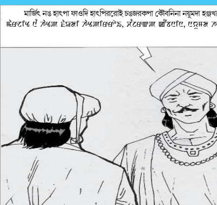
মৰ্জিৎ নঙ হাংগা ফাওদি হাংপিলৱেই চঙজৰকপা কৌবিননা নমুনা হঞ্জখৰো।