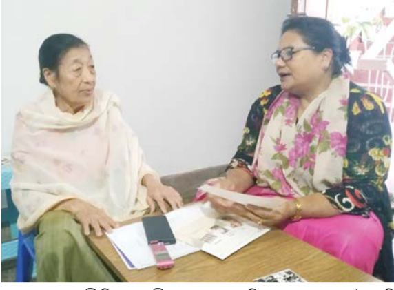
য়াম্সু থাগংপীথি। মদুগী মখা চখরকপা ওইনা ওল্লকপা চী কুমজা ১৯৫২ অসিদদি নুপী হোক্কিগী অনৌবা টিম অনী অসু থোবুঙনা পুরা টিম মরি শুরকথি। টিমশিং

হৈনরকপদগী নুপী হোক্কিসি মণিপুর ওলিম্পিক গেমসতা যাওরকথি। মণিপুরদা নুপীনা হোক্কিসি পায়দনা শান্নরকথিবসি কুমজা ১৯৫১ গী মতমসিদগীনি। হায়রিবা মতমসি ইদি দয়গী মফম অমদুদা নুপীনা হোক্কি শান্নবগী পাউ তাদ্রি। এখোয়দি হোক্কিসি মণিপুর ওলিম্পিক গেমসতা কলিম্পিটসিন তৌনরগনি হায়বদগী এখোয়গী কুব ইফ্ফাল স্পোর্টিং কুব হায়বসিদা এহাক ইশামক যাওদনা শান্নরকথি। কুমজা ১৯৫১দা ইফ্ফাল স্পোর্টিং কুবতা যাওদনা শান্নাশিবা নুপী হোক্কি শান্নরোয়শিং অদুদি মথং শীংনা থিঙবাইজম ইবেমহল (লেফ ইন), নিংইজম মোমোন (সেন্টর হাফ), এ ইশামক (সেন্টর ফোরার্দ),