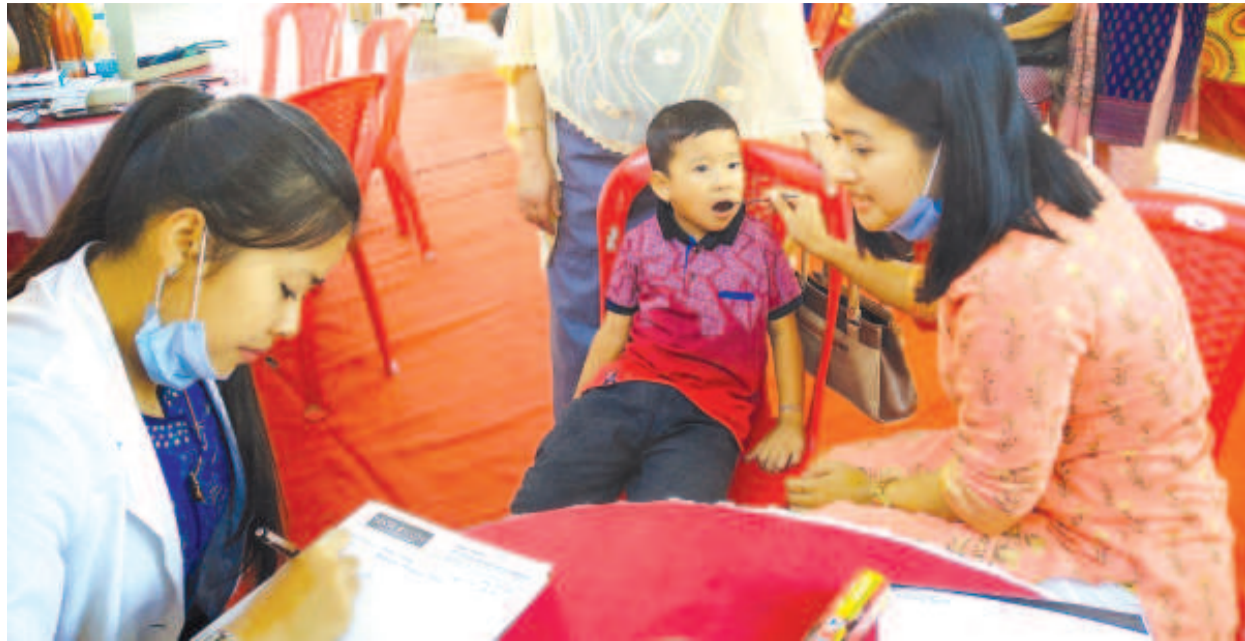
কেশামপাং লাইশোম লৈরজা লৈবা দেটেল ষ্টুডেন্স শীড়না কৈশামপাং লৈমজম লোকাইগী হাইফ খৌনি শঙলেনদা পাঙথোকপা লোম্বা লায়ংবগী কেপ্প

টোম্বাংখোঙ/খোঙ হান্না যাদবা, খোঙ হান্নগসু য়ান্না লিক্কা হান্না, অমাঙথোং ময়াদা হরাই মঙ্গল মরুমকু চাওনা পোমথোকপা লৈবা, অমাঙথোং মপানদু তংলগা য়ান্না থুগ্না অমদি শাবা, ফকী রাংপা, খোঙ হান্নদা অদুম শংলগা লৈনংবা ফহনবগী ওজা জিয়া উল হকপু থাগৎচরি