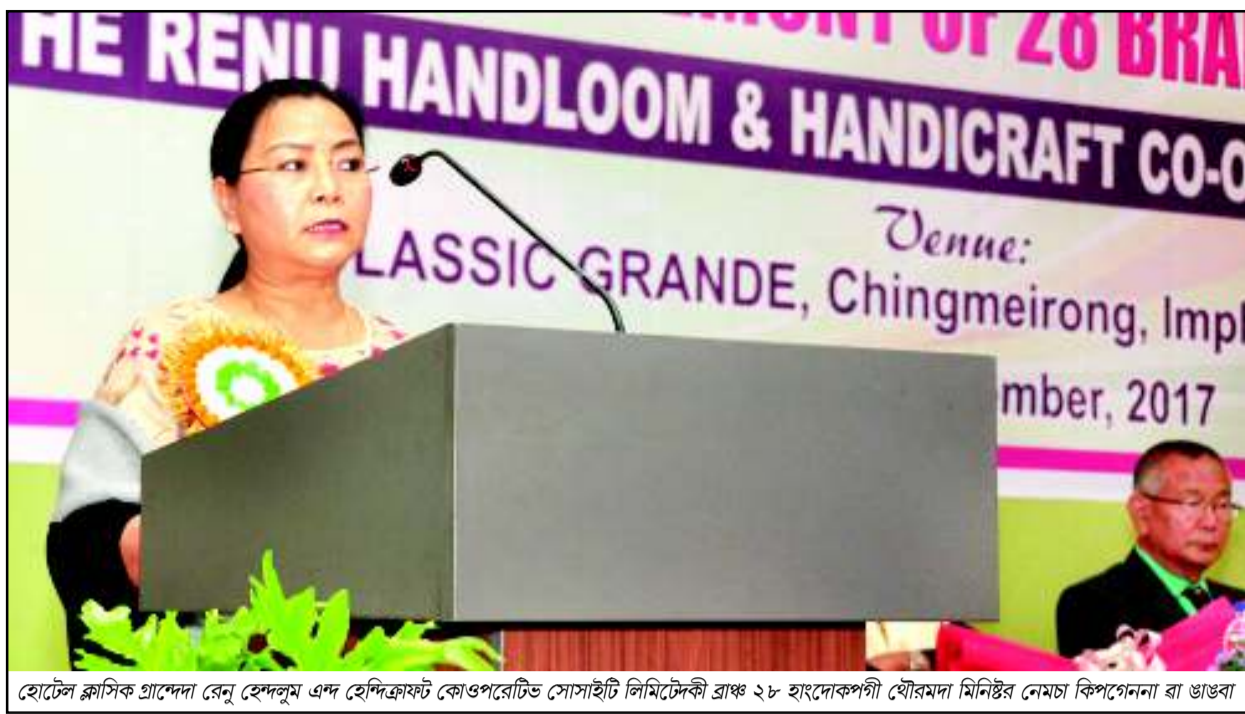
হোটেল ক্লাসিক গ্রান্ডে রেনু হেন্দলুম এন্ড হেন্দিফ্রাফট কো-অপারেটিভ সোসাইটি লিমিটেডকী ব্রাঞ্চ ২৮ হাংকোপপী থৌরমদা মিনিষ্ট্রি নেমচা কিপগেননা রা ঙাঙবা

টোপমসে/অমাঙথোং অকোয়বদু থাগংলগা চাউখংলগা লৈবা, খোঙ হান্না খুদিংগী থাগংলগা লৈবা অকোয়বদু চেকখায়রগা ঙৈ দ্রোপ দ্রোপ তারকপা, খোঙ হান্না চাং নাইদবা, খোঙ হান্না যাদবা শংনিংবা পোকপা, খোঙ হান্না কমা শংলুবা মতমদা কোভা পাল্লগা কোক চিকপা ফহনবগী ওজা Zia-UI-Haque পু থাগংচরি