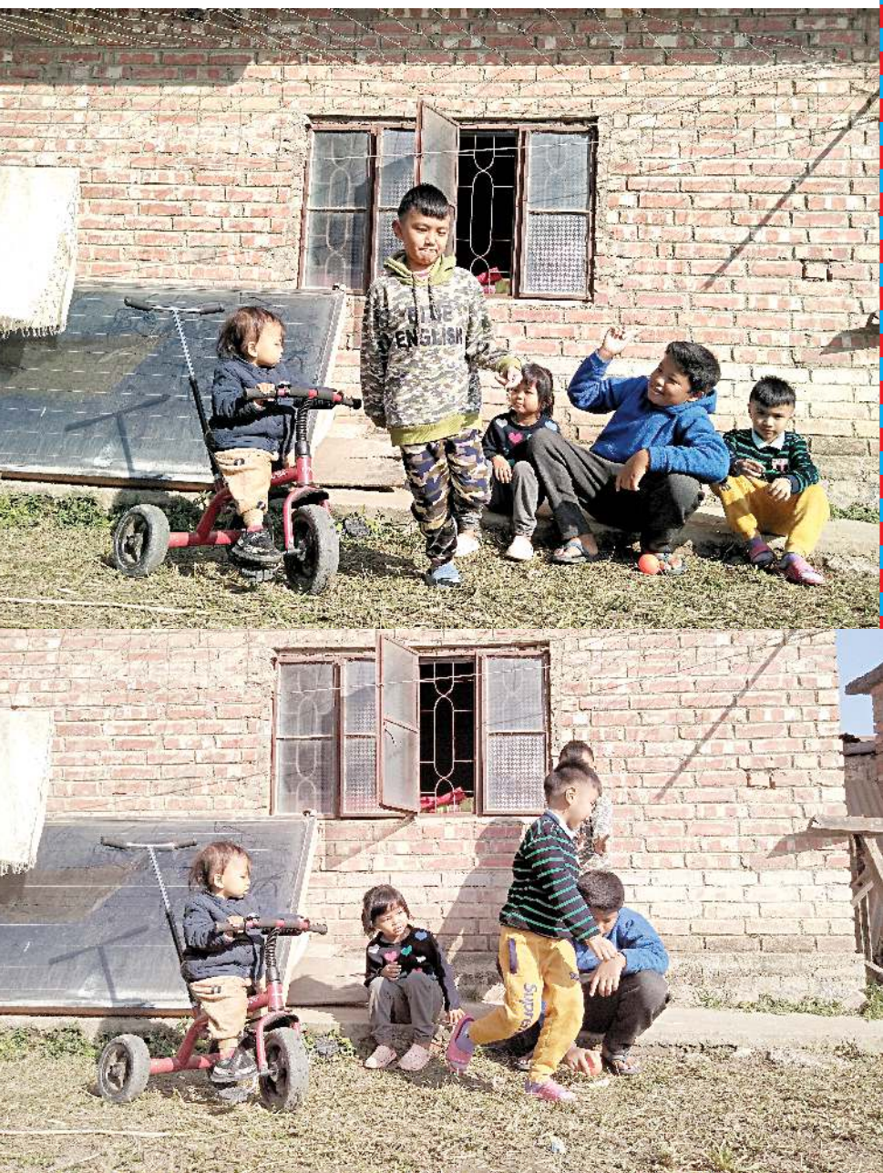
স্কুল চত্বর্দগী অঙাংখিং ময়ুমদা মচিন মনোওখিংগা পুয়া শারমিমবা ফংই, স্কুল চত্বর্দগী প্রাপ্তিওট্ট ট্রান্স ওমদি হোম বর্ল্ড তৌনবা হেংনবদা মমা মপা, মচিন মনোও শারমিমবা ওমত্তা ফংই। তৌদবা য়াদবা অচিন্তা ভাঙনবা অঙাংখিংদু অরায় ওইহল্লি। অঙাংখিংগা হোম নুং ভাঙিনা শারমিমবা পাম্মী, মথোয়না শারমগা তম্মী, শারমগা ফংই, শারমগা শিংগা হোম য়ীরম খুদি-মক্তা হেল্লখই।