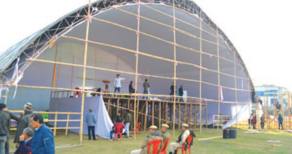
প্রাইম মিনিষ্টর নরেন্দ্র মোদীনা মণিপূরদা থুংলরবা মতুন্দা জোঙান-তোঙানবা প্রোজেক্ট কস্মা শঙ্গাবগা লোয়ননা রা ডাঙগদৌরিবা হপ্তা কাঙজৈবু শেমজিন শাজিনবা

টোপমসেপ/নাতোন মখল অনীমক ফুনবা, নাতোনদা শুর হোনবদা য়ান্না রানা হোনবা, অয়ান্না য়ারোমদা হোনবা, নপ মহি তাবা, নাহি তাবা, কোক চিকপা অমদি ঙাওবা, ওকশম মরি নাবা, মীং নুংঙাইতবা ফহনবগী টেট অমসুং নেসনল এরাৰ্দ ফঙলবা ওজা জিয়া উল হকপু থাগৎচরি