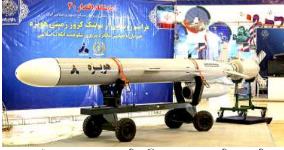
ইৱাননা হাতখিনা ফোঙদোকখি। মালেমগী পৱাৰশিংগা কুমজা ২০১৫ দা ন্যুট্ৰিয়ৰ দিল অমা য়ানবা পুৱকখিবদগী য়ুনাইটেড ষ্টেটসনা ৱাৰিং কয় পীৱবসু ইৱাননা মসিগী মিসাইল প্ৰোগ্ৰাম হোৱা পাকথোক চাউথোক হনখি। হৌখিবা জুৱানৱাৱীদা লৈবাক অসিনা স্পেসতা সেটলাইট অমা থাগংবদা হোৎনখিবা ফেল ওইখি। লোখ অদু ৱাশিংগা য় এন সিকুৱিট কাউন্সিলগী ৱিজেণ্ডালুসন থোমঙনে হায়না ফোঙদোকখিবা ৱোকত লোখ অছগী মায়েজা য় এনা ৱাৰিং গীথিবা মতংদা পাঙথোকখিবনি।

দুবাই, ফেব্ৰুৱাৰী ০৩ (এজেসী): কুমজা ১৯৭৯ গী ইসলামিক ৱেভলুসনগী কুমওন খৌৱমদা ইৱাননা থাংজ নুমীংতা কিলোমিটৰ ১,৩০০ শানবা অনৌবা ক্ৰুজ মিসাইল অমা মায়খুম হাংখে হায়না ষ্টেট টেলিভিজনগী পাঙথা হায়রি। ইৱাননা য়ুনাইটেড ষ্টেটসকী অখিবা অমসুং য়ুৱোপকী লৈবাকখিংগা য়ানিংদা ফোঙদোকখিবা কয়গী ওৱ-তৌবদা লৈবাক অসিগী মিসাইল প্ৰোগ্ৰাম মৰুওইনা বেলিষ্টিক মিসাইলশিংগী প্ৰোগ্ৰাম হোয়া পাকথোক চাউথোক হনখি। তেহৱাননা প্ৰোগ্ৰাম অদু শুপগী মশা ঙকথোকচনবগীনি হায়রি। থাংজগী অথংবদা ৱেভলুসনৰি গাৰ্দকী সিনিয়ৰ কন্সাম্ভৰ অমদা মসিগী কৱপল হায়খিবা, ইৱাননা বেলিষ্টিক মিসাইলস ডিভলপমেণ্ট কন্ট্ৰোল তৌনবগী মতংদা য়ুৱোপকী ক্ৰুজ মিসাইলশিংগী প্ৰোগ্ৰাম অমসুং তেহৱাননা হৌজিক লৈৱিবা পনটৈ অদুদগী হোয়া চাইথোকহনকৰুপা য়াই। মিসাইল মায়খুম হাংখিগী থৌৱম অদু ৰা গাঙলদুনা ডিফেন্স মিনিষ্টৰ অমিৰ, হাতখিনা হায়খি, ক্ৰুজ মিসাইল অসি শীজিমবনগীমক শেম-শাবদা (প্ৰিপাৰেদনেস) মতম