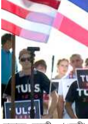
হোনোলুলু, ফেব্ৰুৱাৰী ০৩ (এজেসী): য়ু এসকী অহানবা হিন্দু কোংগ্ৰেস ক্ৰমেন তুলসি গববাৰ্দনা ২০২০ গী প্ৰসিদ্দেণ্টগী মীখলগা মৰী লেননা হৱাইয়ীদা মহাক্কী কেম্পান হৌখে।

মশাগী হায়বা থাদোক্ৰ গা মীয়ামগীদমক, লৈবাক্কীদমক থবক তৌবগী ৱাখল্লোন অসি লাম্বী খুদিংমত্তা অমদি সাৰ্ভিস মেয়ৰ খুদিংমত্তা চেঞ্জি। ওসি ঐথোয়গী অসিগুৱা ৱাখল্লোনগা লোয়ননা য়ুনাইটেড ষ্টেটস ওফ অমেৰিকাগী প্ৰসিদ্দেণ্ট খববগী মীখলাদা কেদেদেট ওইহনগনি হায়না লাউখোকখি হায়না থাংজ নুমীংতা হোনোলুলুদা পাঙথোকখিবা থৌৱম অমদা গববাৰ্দনা ফোঙদোকখিবা ৱাফম পল্লুনা সী এন এনা হায়খি। অশেংবা লাম্বীগী অসিগুৱা ফীডমশিং, ৱাখল্লোনশিং হুইট হুইট পুশিন্দনা ঐথোয়গী প্ৰসিদ্দেণ্টা থল্লিবা ষ্টকাৰ খুলায়, মসিগী চাউথোকচবগী ভেলুশিং হঞ্জিনহল্লগনি। পুন্সকসিগী মতং