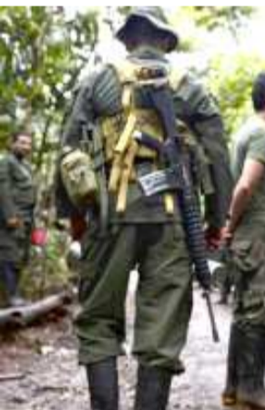
ৱাশিংগন, ফেব্ৰুৱাৰী ০৩ (এজেসী): গভৰ্ণমেণ্টগা য়ানখিবা ২০১৬ কী পিছ দিল অমগী মখাদা খুংলায় শীজিমবা থবক থৌৱমশিংগী লেপু হায়বা য়াদনা লৈৱকখিবা কলহীয়াগী লালহৌবা লিদৰ অমা থাংজ নুমীংতা আৰ্মদ ফোৰসনা হাংখে হায়না প্ৰসিদ্দেণ্টনা ই ভান দুকিনা ফোঙদোকক্ৰে।

ৰোয়িগো কেদেতি হায়না খঙনবা ক্ৰিমিনেল অদু হাংপা ওয়ে হায়না মানিজালেস সিটিদা পাঙথোকপা থৌৱম অমদা দুকিনা লাউখোকখি। থৌৱম অদু মতংদা ডিফেন্স মিনিষ্টৰ ওইইৰ্মো ৰোভেৰোনা হায়খি, কেভেন্জা দিসিদ্দেণ্টশিং থোমজিন্দনা অনৌবা গ্ৰুপ অমা শেমখি। ওপৱেসন অমদা অটৈ ওগ্ৰিলা ফাইটৰ মাপনসু হাংখি অমসুং অটৈ কয়না ফাখি। লৈবাকুশিন-থুংনা শণে দাক্ৰবা দিসিদ্দেণ্টশিংগী য়ুনিট ৩০ ৱোমদা কন্ট্ৰোল্ট ১,৮০০ ৱোম লে। পিছ একোৰ্দ অদুগী মখাদা কন্ট্ৰোল্ট ৩,০০০ য়াওনা ফাৰ্ককী মেয়ৰ ১৩,০০০ ৱোম খুলায় থাদোকহনখি। গ্ৰুপ অসি হৌজিঙি পোলিটিকেল পাৰ্টি অমা ওয়ে অমসুং ২০১৬ ফলওদা গ্ৰুপ অসিবু কোংগ্ৰেস সিটি ১০ শোয়দনা পায়হনবগী ফীডমদা লৈবাক অদুগী অমগী জেপ মেয়ৰ অমা ওইখি হায়রি। ওসি অয়েং অপন অমত্তা য়াওদনা চথখিবা ওপৱেসন অমদা ঐথোয়গী লৈবাক্কী টেৰিৱিজমদা খুইদগী কিনবা ফিগৰিশিংগী মনুংতা অমা ওইৰিবা