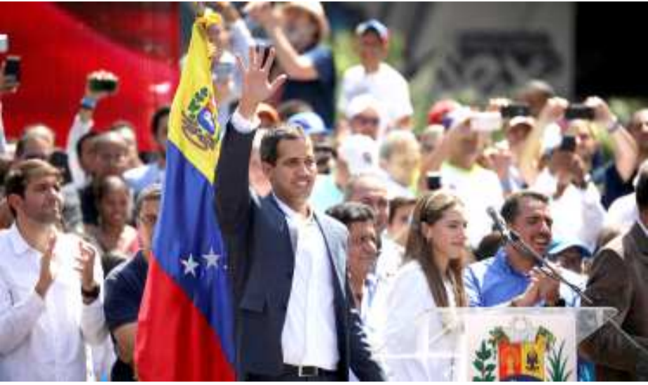
থোকখিবিবা ইকনমিক কন্ট্ৰোলস অমদা মরম ওইদুনা মীয়ান্না পাম্ভবনি হায়নবা মাদুরোদীমতত্তি মিলিটৰি সপোৰ্ট হায়বাসি য়ান্না মরুওই। মাদুরোনা মহাক মুনাইটেড ষ্টেটসনা ইথিল পীদুনা পাঙথোকপা কু অমগী ভিক্টিম অমনি হায়না ক্ৰেম তৌৱি। মহাকপু শৌগৎপাশিংদা ৰা গাঙলদুনা মাদুরোনা হায়খি, মতিক

করাকাস, ফেব্রুৱাৰী ০৩ (এজেসী): ভেনিজুএলাদা প্ৰসিদ্দেণ্ট নিকোলাস মাদুরোনা মহাক্কী লেঙাক ফনা উহয়বা হোৎনরদনা পাল্লিয়ামেণ্টৰ মীখল নোনা পাঙথোক্ৰবগী ৰাফম থাংজ নুমীংতা হোদোক্ৰে। মীওই লিংশিং কয়ানা লম্বীদা থোক্ৰা মহাক্কী লেঙাক্কী মায়েজা প্ৰোটেষ্ট তৌৱকখিবগা দৈৱায়ননা সিনিয়ৰ জেনৱেল অমা ওপোজিসনদা চেংশিনখিবা মতংদা মাদুরোনা মীখল নোনা পাঙথোক্ৰ বগী ৰাফম লাউখোক্ৰখিবনি। লৈবাক মনুংগী ওইনা অমসুং মালেমনা মাদুরোদা ফম থাদোক্ৰবা প্ৰেচৰ পীবা হেনগৎলকপদগী এয়ৰ ফোৰসকী সিনিয়ৰ জেনৱেল অমা মহাকপু থাদোক্ৰগা ওপোজিসনগী মায়কৈদা লেপখিবনি। থাংজগী অউনদা চহিখোক্ৰখিবা ভিডিও অমদা সিনিয়ৰ জেনৱেল অদুনা পাল্লিয়ামেণ্টকী মকোক অমসুং মশানা ইন্টাৰিম প্ৰসিদ্দেণ্ট ওইৱে হায়না লাউখোক্ৰখিবা জুৱান গুৱাইদোবু শৌগৎপা ফোঙদোকখি। মীওই মিলিয়ন কয় লৈবাক থাদোক্ৰনা চেমিখিবা মমাঙদা অম্জ