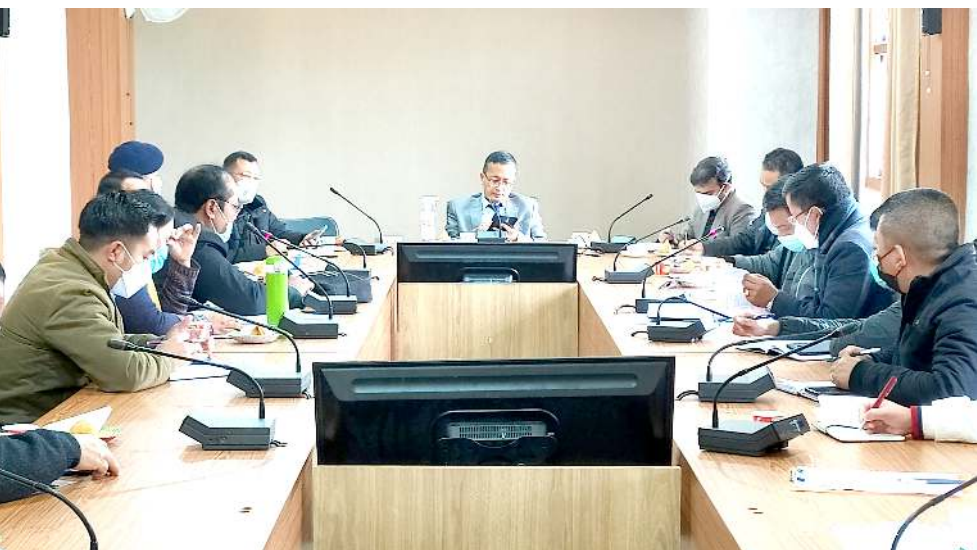
এদিয়েল চীফ ফোৱেটৰি ডুলুনমাঙনা চোৱ লৌদুনা চুৱাচন্দপুৱ দি সী ওফিসতা কোভিড-১৯ ভেক্সিনেসনগা মৰী লৈননা দিষ্টিক্ট এডমিনিষ্ট্ৰেচনশিংগী মীফম পাঙথোকখিবা