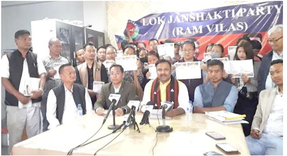
নাগালেণ্ড : মীখল মমাংদা জে দি-য়ুদগী তৌজুনা এল জে পিদা য়াওৱকশুৰা কিতোহো এস ৰোতোখাবু তৱায়া ওকপগী খৌৱমদা শৰুক য়াখিবশিং

অমৰোমদা বি জে পিগী নেসনল প্ৰসিডেণ্ট জে পি নন্দা গুসি ত্রিপুরাদা থুংগে হায়ৱি।