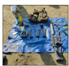
টিমুকিয়া, মাৰ্চ ৩ (এজেন্সী):

নোৰ্ট ইষ্ট ৱেজ্জী দিপটি ইলপেৱ জেনৱেল জিতমাল দোলিনা লুচিংবা অসাম পুলিস অমদি অসাম রাইফলসগী অপনবা টিম অমনা অৱনাচল প্ৰদেশকী চালাং দিষ্ট্ৰিক্ট মনুং চালাং নামগোদা পাঙক্কা থিবা হুদুগী থবক চখাবা লোনা থিংখুৱা অসামদা বেজ তৌবা খুলায় পায়বা উলফা (আই) গী কেমদর অনী সেরেদর তৌৱকপদগী অসাম পুলিসনা ফাৰা গুমেত্ৰে।