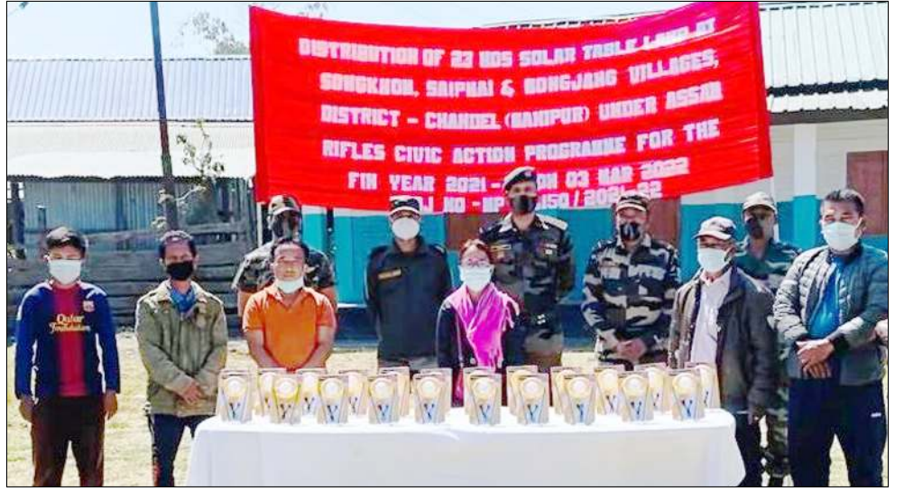
আই জি এ আর (সাইথ) কী লমজিং মথানা শৰিক তস্পাক বটালিয়াননা অসাম রাইফলস সিতিক ওয়ন প্ৰোগ্ৰামগী মনুংচা চান্দেল দিষ্ট্ৰিক্ট মোগ্ৰা, সোখোম অমদি সাইফাইলা সোলর লেম্পশিং য়েহোকখিবা

চিফ মিনিষ্টরনা মথা তারদুনা, অৰ্বান লোকল বোদিশিংগী মীখল পাঙথোক্কা গুদমবসিনা সেন্ট্ৰেল লৈঙাক্কা নাগালেণ্ডদা চাউথং য়োৱাংগী পীৰকপা গ্ৰাণ্ট কয়া মাঙলে হায়খিগা লোয়ননা হুদুতা সুপ্ৰিম কোৰ্টগী মায়কেন্দিগী স্টেট লৈঙাক্কা পাঙথোক্কা নুপীশিংগী